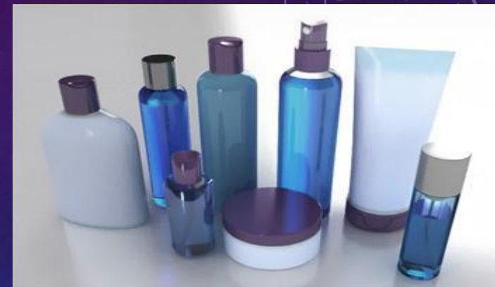
СОЗДАНИЕ ПАРТИИ ОБРАЗЦОВ