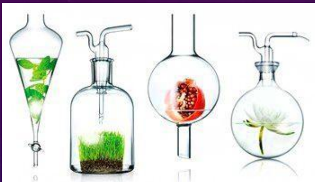
ФОРМИРОВАНИЕ ИДЕИ ПРОДУКТА