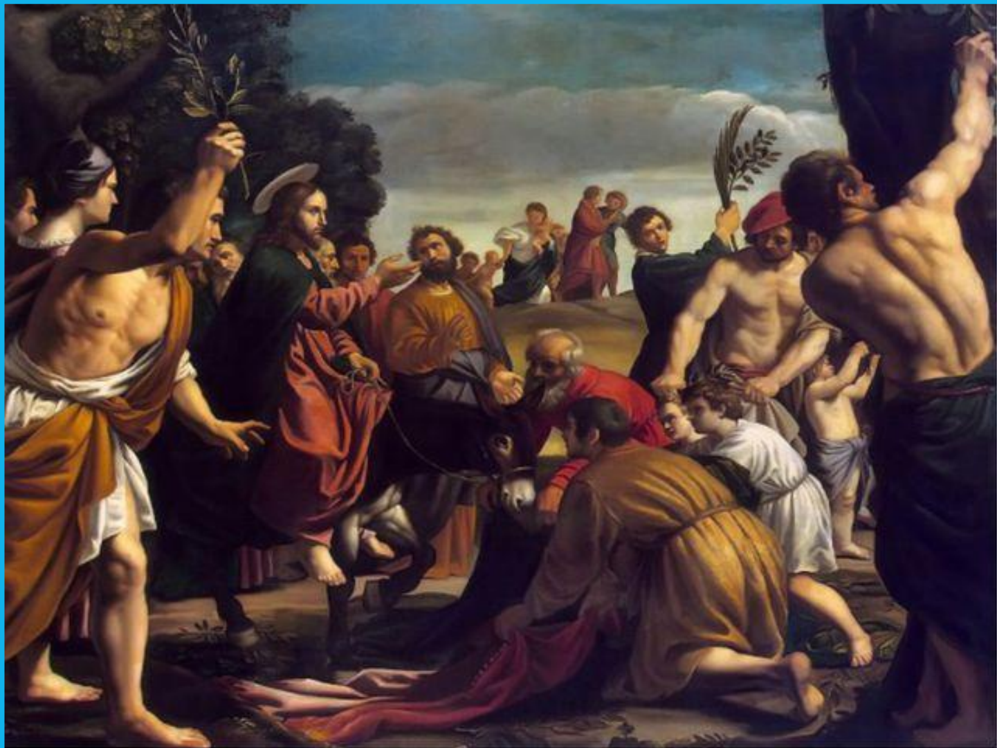
Вход Господень в Иерусалим