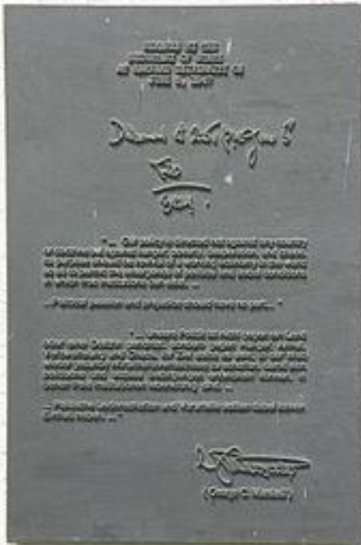
Мемориальная доска на памятнике Маршаллу на Лангвассере в Нюрнберге