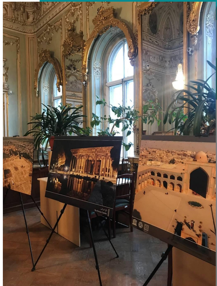
Выставка: объекты всемирного наследия ЮНЕСКО в Иране