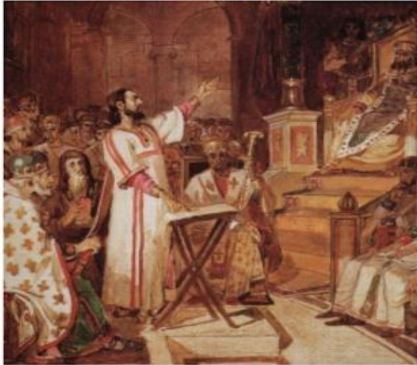
Василий Суриков «Первый Вселенский Никейский Собор»