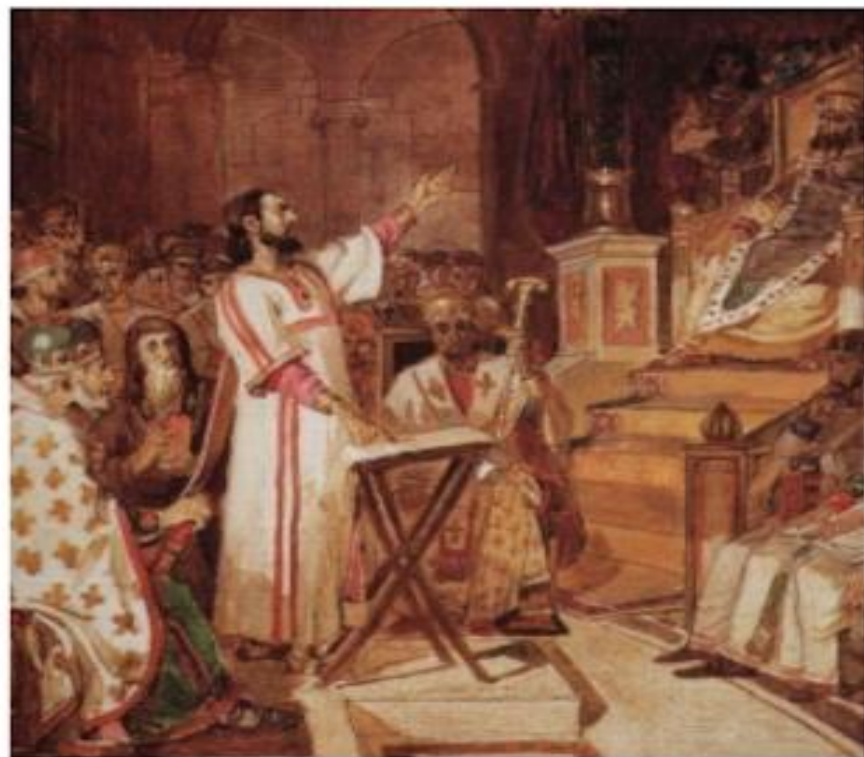
Василий Суриков «Первый Вселенский Никейский Собор»