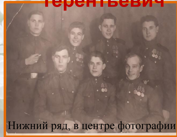
Нижний ряд, в центре фотографии