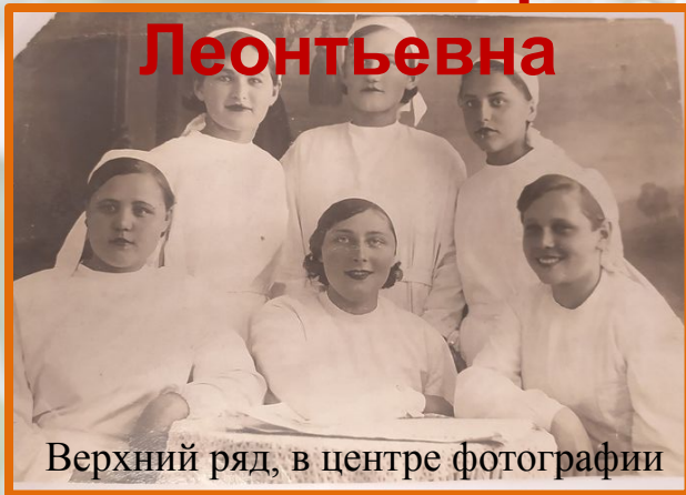
Верхний ряд, в центре фотографии