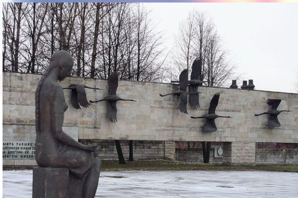
г. Санкт-Петербург, Россия

На многих памятниках в разных уголках мира взлетели и навечно застыли в полете журавли.