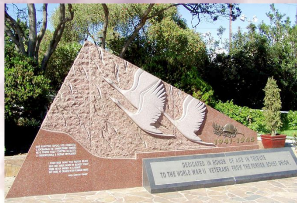
США. Штат Калифорния.