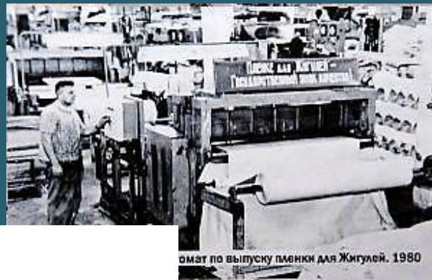
В цехах завода «Искож»

омат по выпуску пленки для Жигулей. 1980