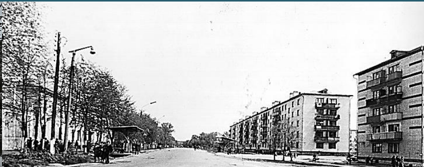
Жилой городок завода «Искож»