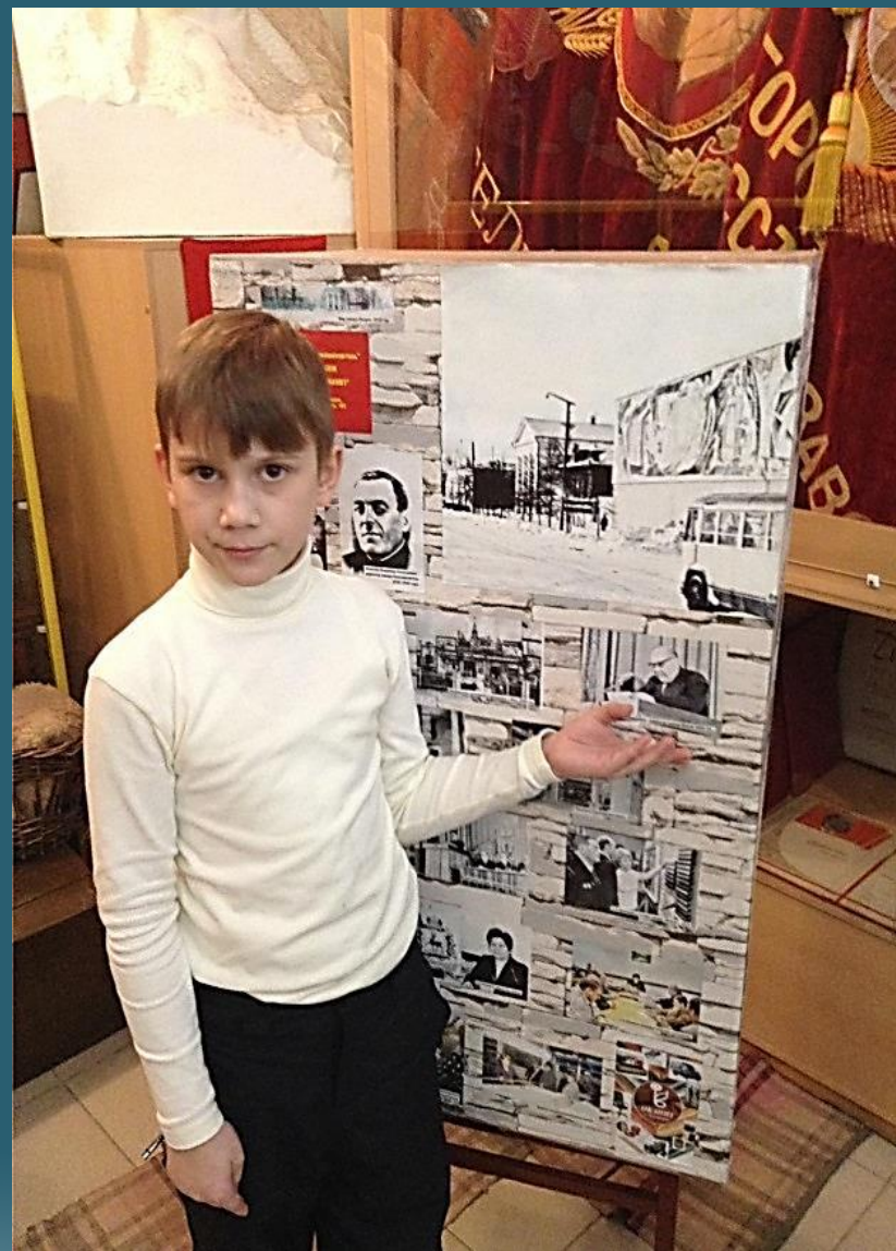
Городской музей: экспозиция, посвященная заводу «Искож»