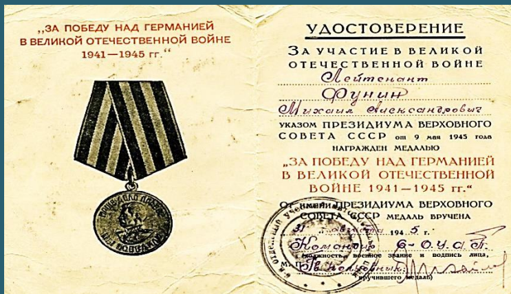
Удостоверение к медали «За победу над Германией в Великой Отечественной войне 1941—1945 гг.»