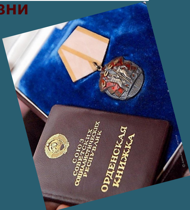
Орден «Знак Почета»