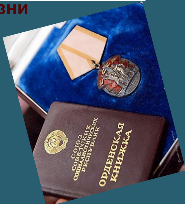
Орден «Знак Почета»