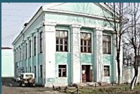
Клуб завода «Искож»

Фотомат по выпуску пленки для Жигулей. 1980