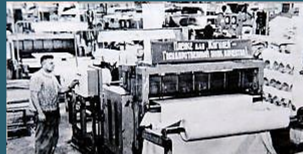
В цехах завода «Искож»

Фотомат по выпуску пленки для Жигулей. 1980