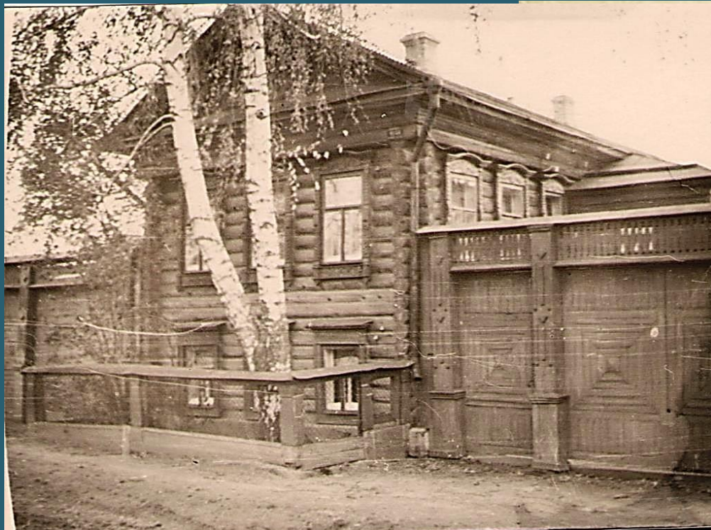
Родительский дом на улице Сушникова