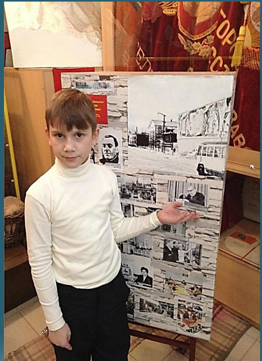
Городской музей: экспозиция, посвященная заводу «Искож»