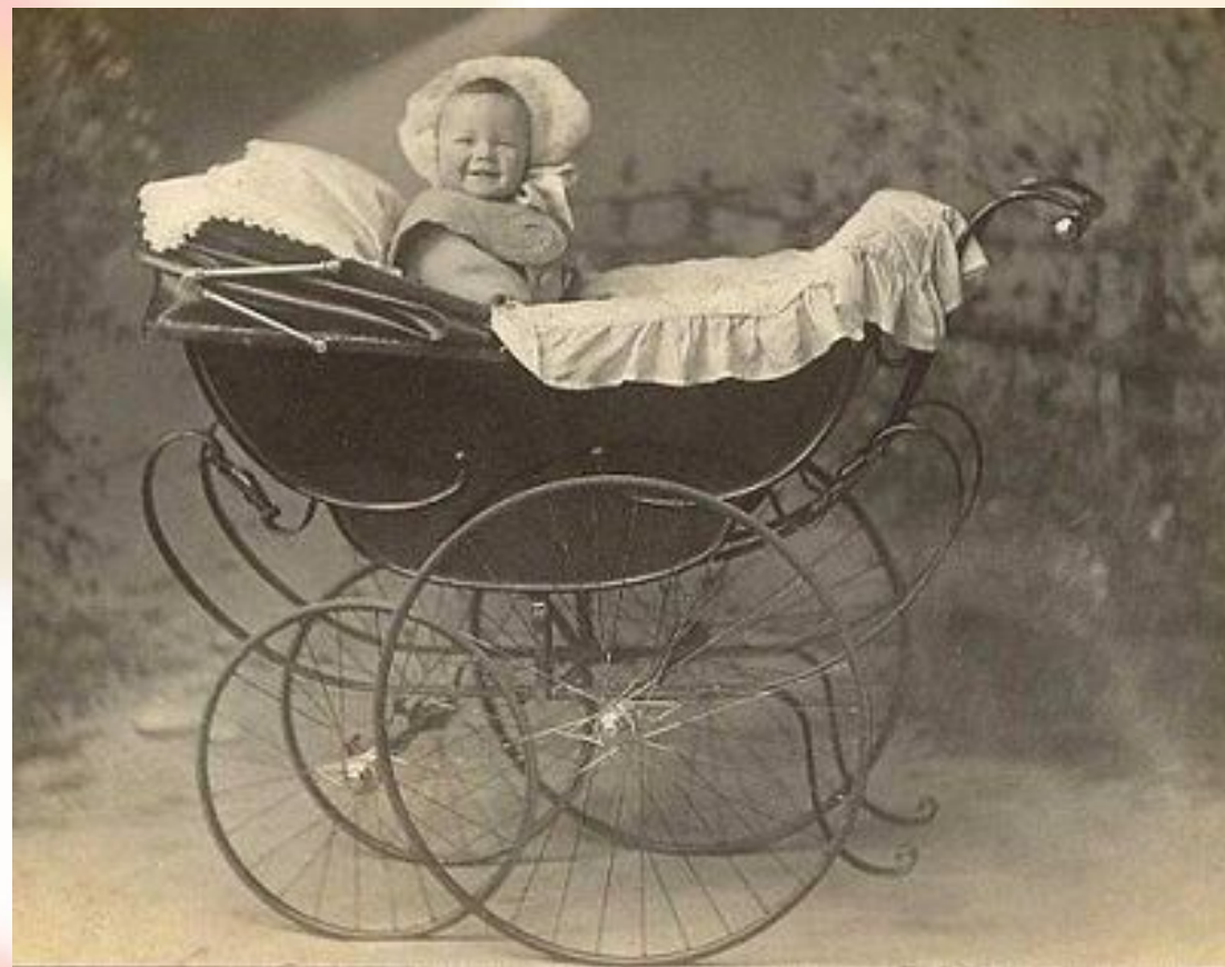
Детская коляска, конец XIX века

К концу 19 века коляски стали действительно удобными, кроме того, массовое производство позволило снизить их стоимость, и позволить себе эту роскошь могли все больше и больше счастливых родителей.