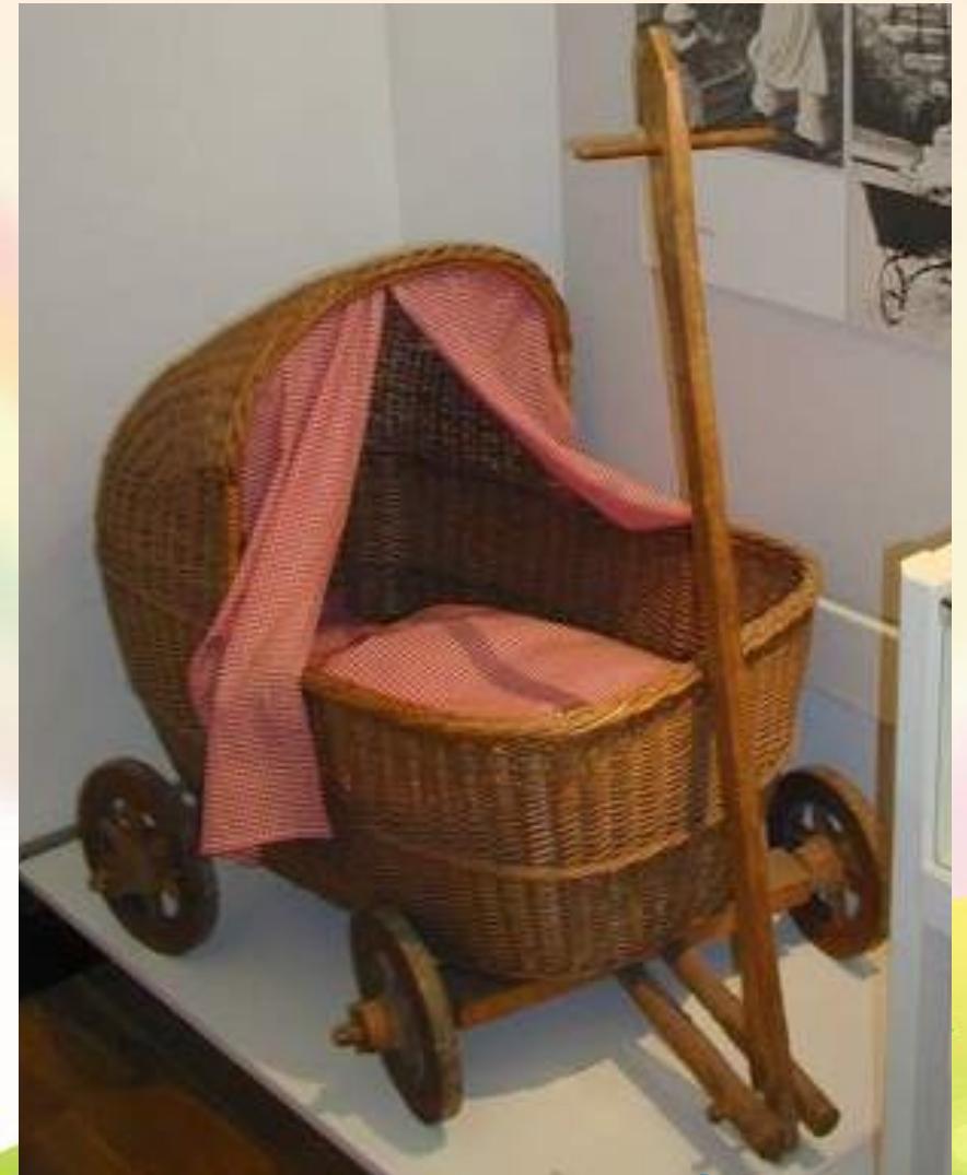
Плетеная детская повозка- XVII век