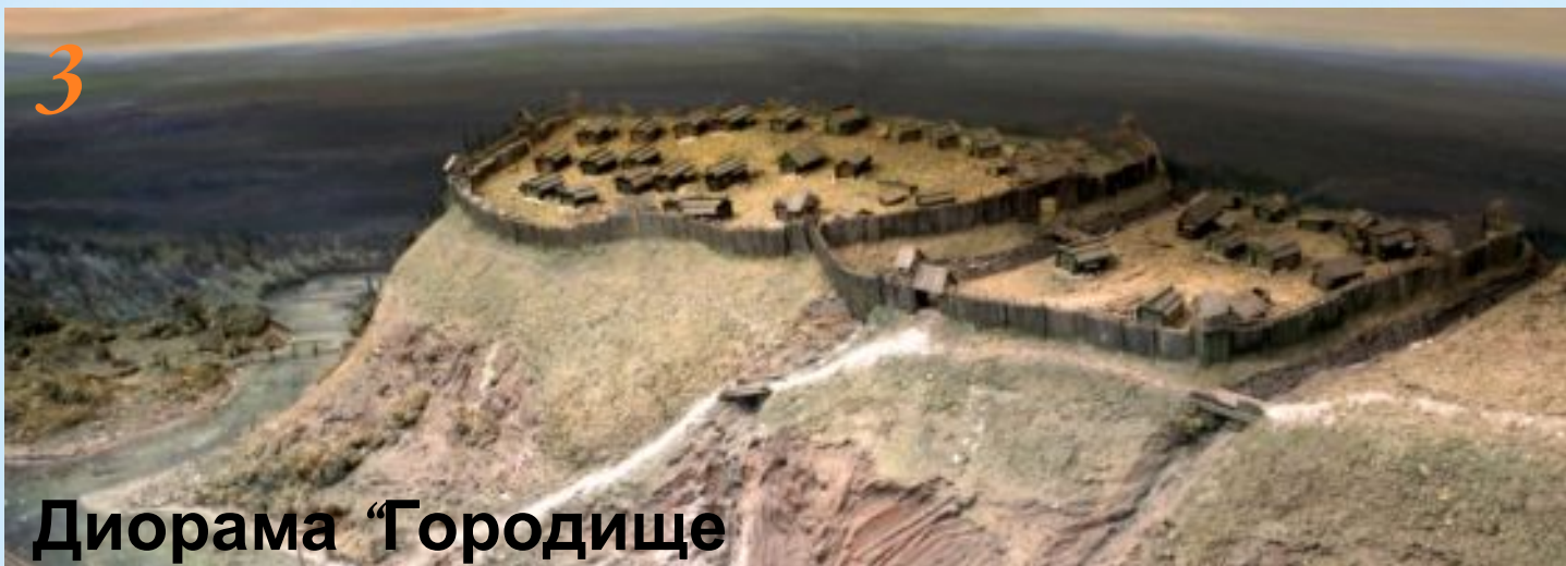
Диорама “Городище Иднакар”