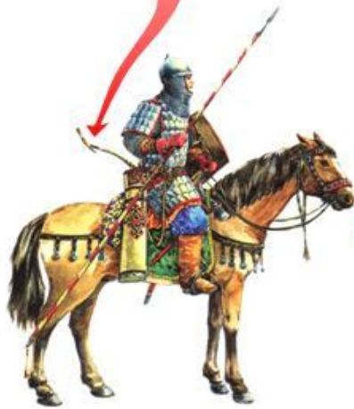
Младшая дружина («отроки»-слуги князя)