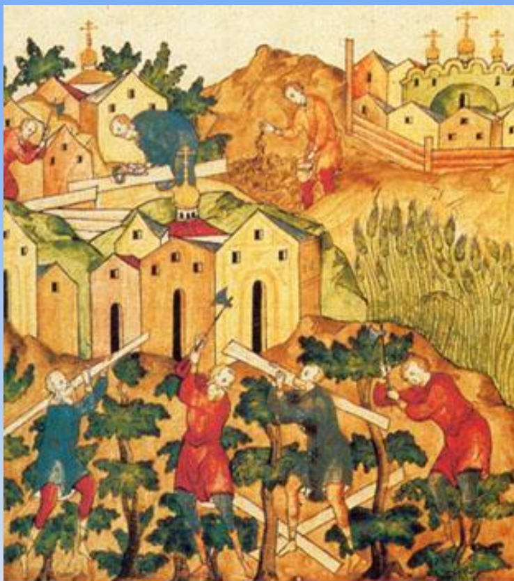
Работа крестьян в монастырском хозяйстве. Миниатюра из "Жития Сергия Радонежского", XVI в.