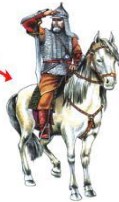
Старшая дружина («князьи мужи»-бояре)