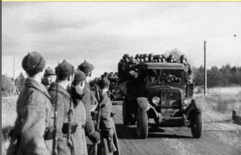
Вступление советских войск в Эстонию. 1939 г.

Советское руководство ожидало сопротивления: органы НКВД подготовили лагеря для приема 50–70 тыс. военнопленных.