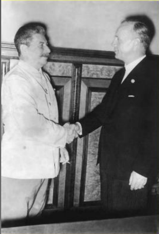
Риббентроп и Сталин в Кремле.

В августе Гитлер стал торопить своих дипломатов.