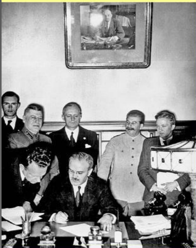
Молотов подписывает пакт о ненападении с Германией 23.08.1939 г.