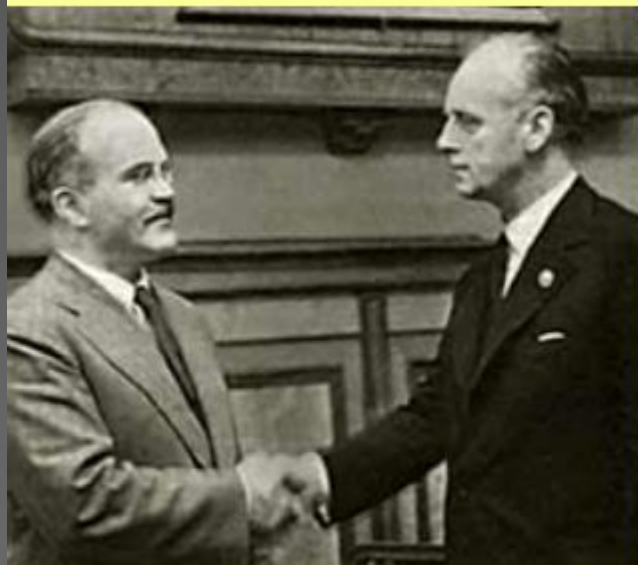
Министры иностранных дел СССР и Германии В.М. Молотов и И. Риббентроп.