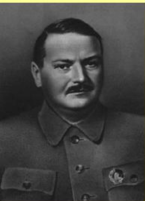
А.А. Жданов, член Политбюро, секретарь ЦК

В Прибалтику были направлены чрезвычайные уполномоченные с практически неограниченными полномочиями: в Эстонию – А.А. Жданов, в Латвию – А.А. Жданов, в Литву – В.Г. Деканозов.