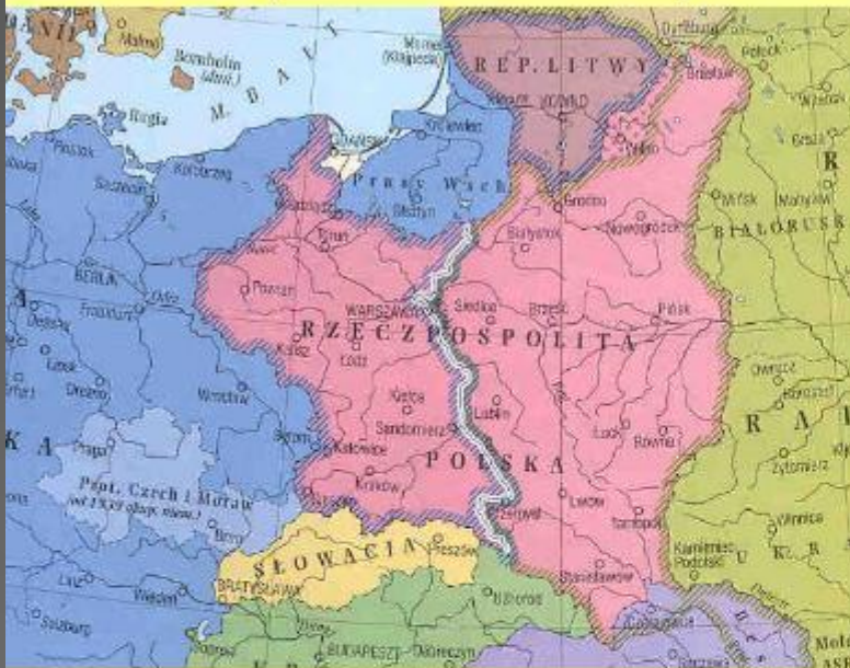
Раздел сфер влияния в Польше по пакту 23 августа 1939 г.

3. В случае территориально-политического переустройства областей, входящих в состав Польского Государства, граница сфер интересов Германии и СССР будет приблизительно проходить по линии рек Нарева, Вислы и Сана.