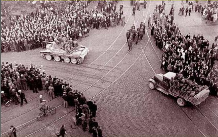
Советские войска вступают в Ригу. 17 июня 1940 г.