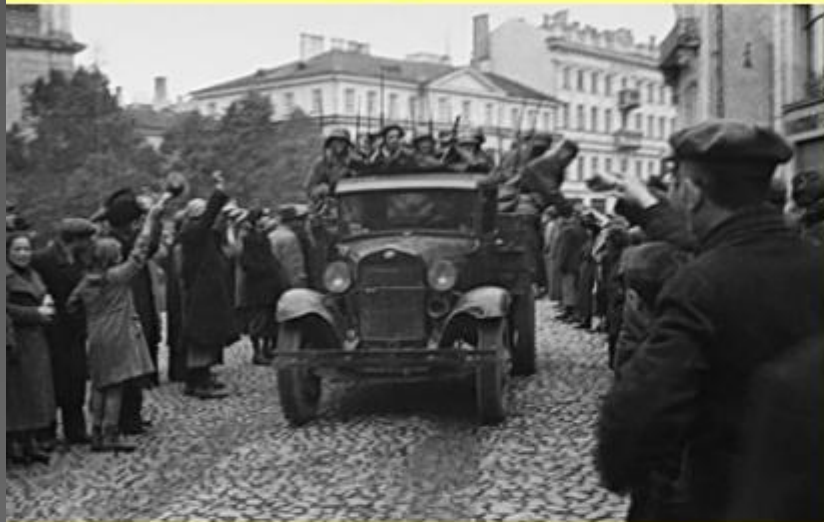
Вступление советских войск в Литву. 1939 г.

В Прибалтику были введены 67 тыс. советских солдат.