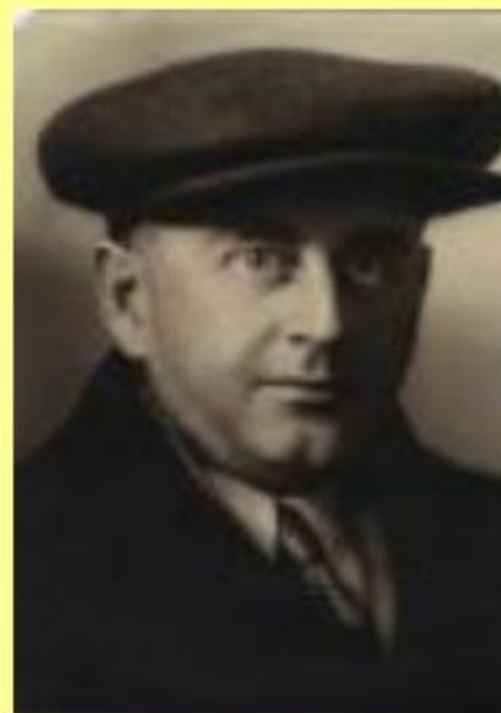
В.Г. Деканозов, зам. наркома иностраннх дел