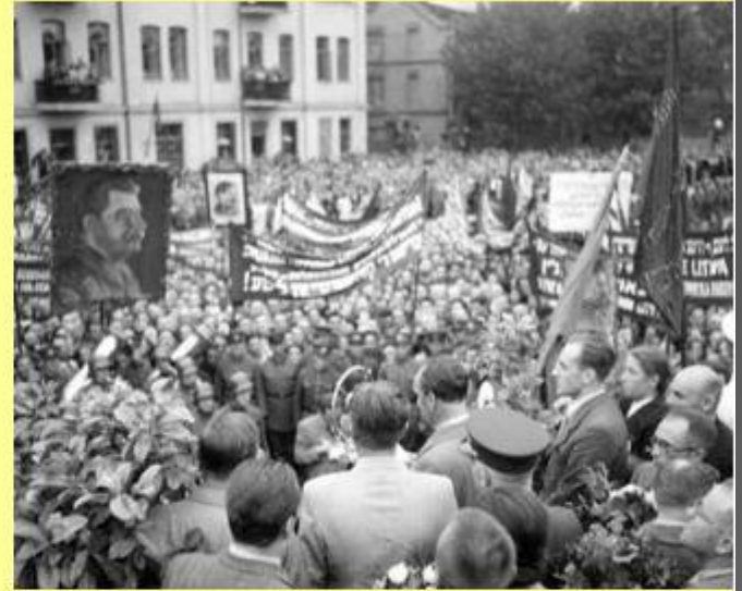
Митинг левых сил в Вильнюсе за установление Советской власти в Литве.