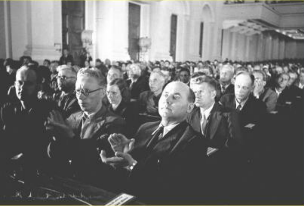
Делегация Эстонии на сессии Верховного Совета СССР. Август 1940 г.

На первых же заседаниях новых парламентов Эстонии, Латвии и Литвы 21–22 июля 1940 г. были приняты декларации о провозглашении Советской власти и направлены просьбы в Москву о принятии их в состав СССР.