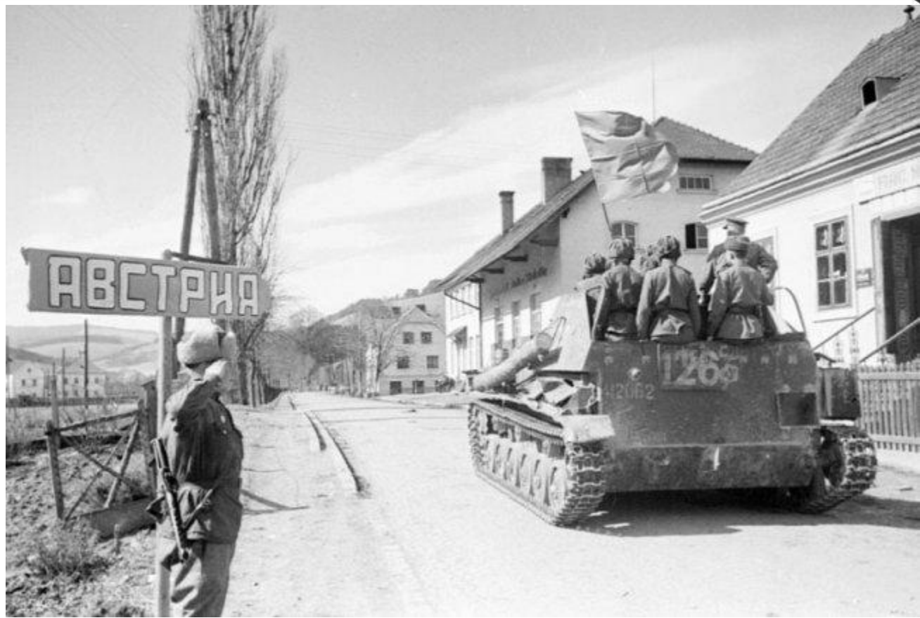
Дорога на юго-запад открыта