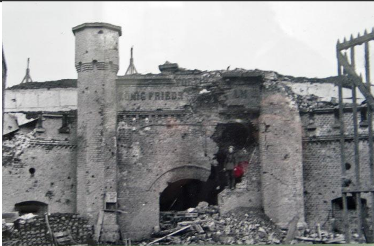
У входа в тыльную часть форта № 5 после боёв. г. Кёнигсберг. Апрель 1945 год.