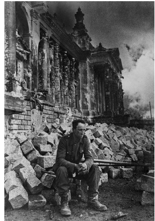
Уличные бои в Берлине