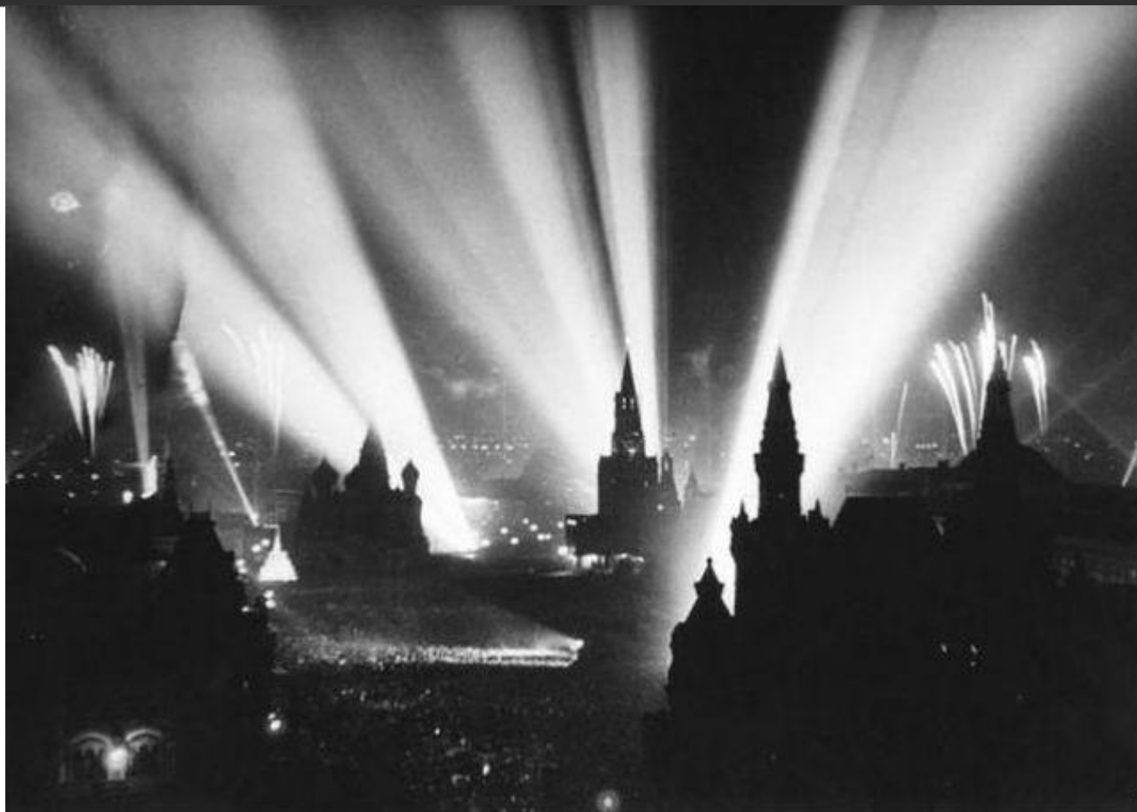
9 мая 1945 года в Москве