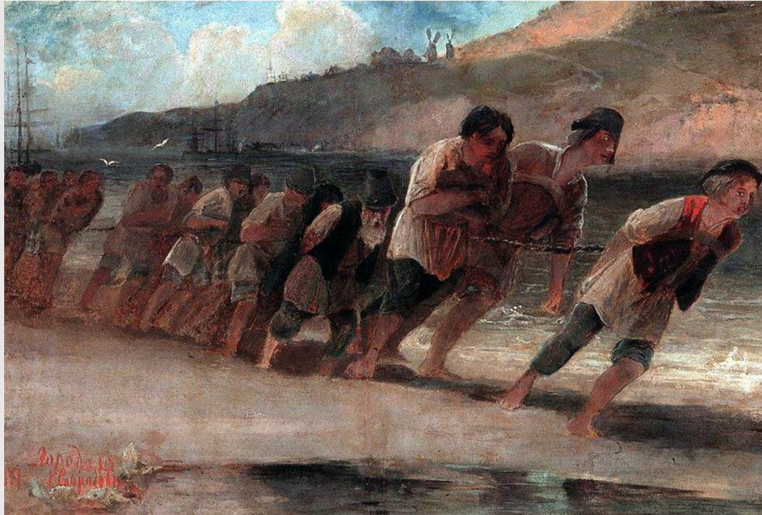
Алексей Кондратьевич Саврасов. «Бурлаки на Волге». 1871.

Алексей Саврасов, автор знаменитой картины «Грачи прилетели», созданной в Ярославле, тоже рисовал бурлаков на Волге. Популярная тема у художников-передвижников, народные страдания.