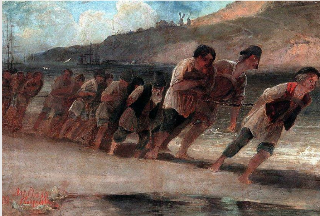
Алексей Кондратьевич Саврасов. «Бурлаки на Волге». 1871.

Алексей Саврасов, автор знаменитой картины «Грачи прилетели», созданной в Ярославле, тоже рисовал бурлаков на Волге. Популярная тема у художников-передвижников, народные страдания.