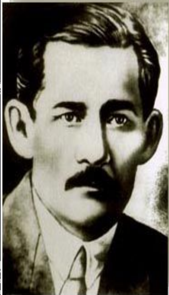
МӘЖИТ ГАФУРИ 1880-1934