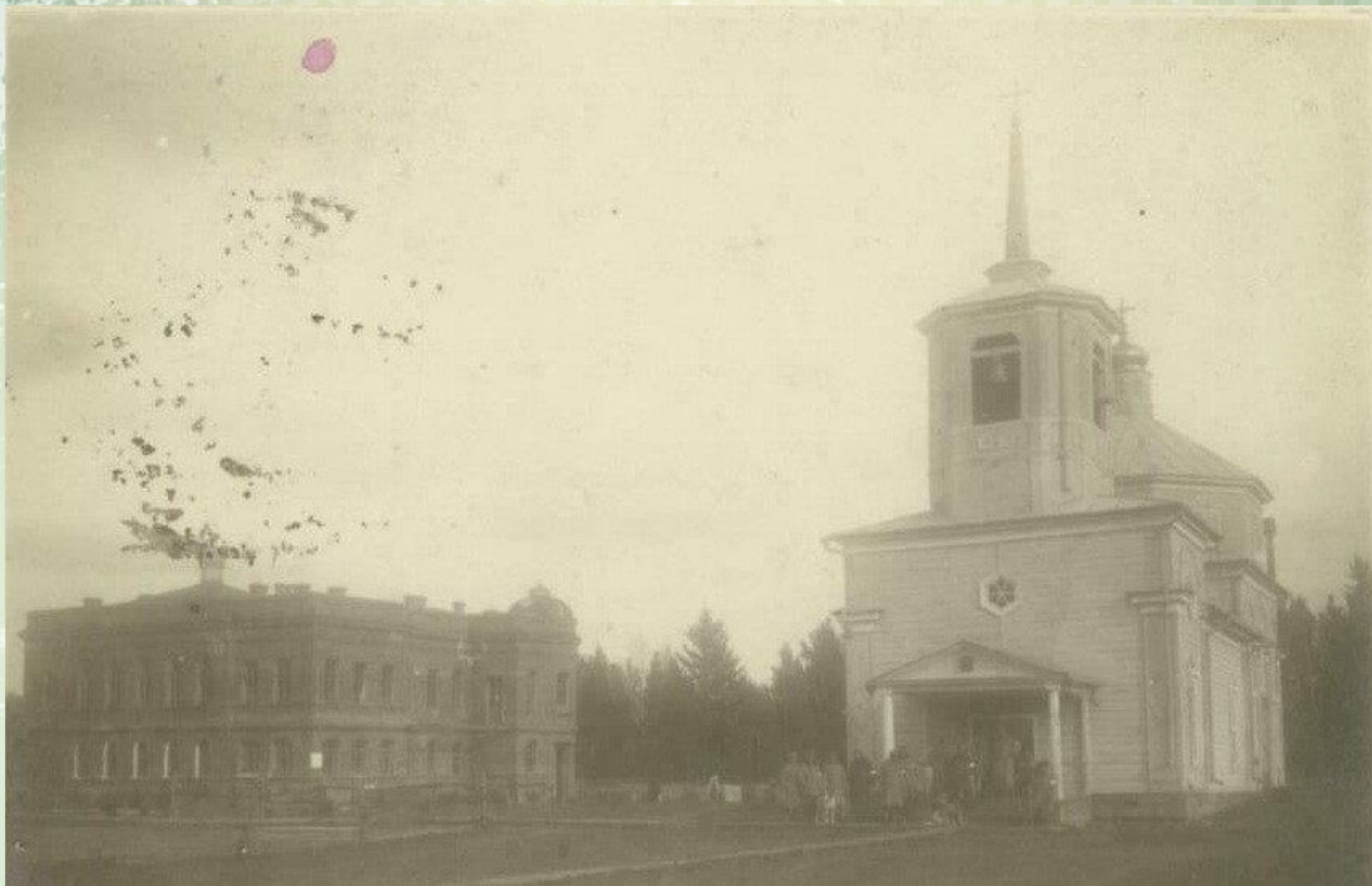
Михайловский скит.