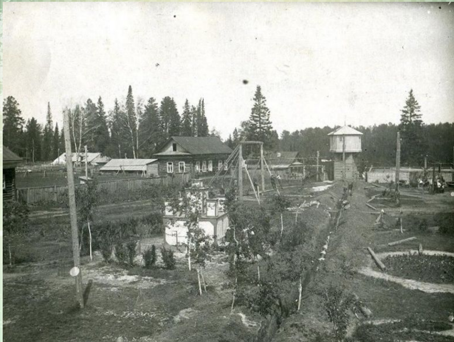
Тобольский дом отдыха (бывший Михайловский скит), 1937 г. ЯНМ-13180/37