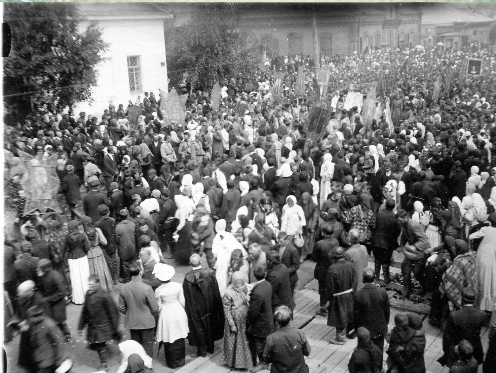
Вынос чудотворной иконы Божьей матери из Абалакского монастыря.