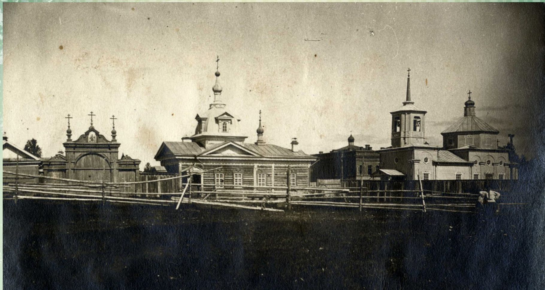
Михайловский скит. ТОКМ ОФ-25873