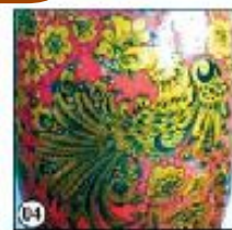
Кудрина "Торжественно" - птицы