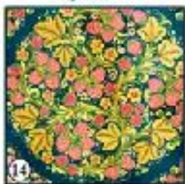
Чёрный фон "Клубника"