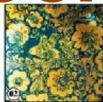
Кудрина "Царская" - птицы