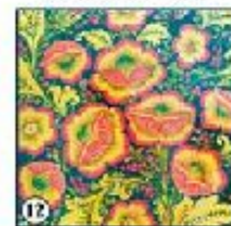
Чёрный фон "Мох"