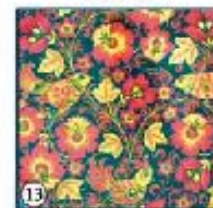
Чёрный фон "Птицы в цветах"