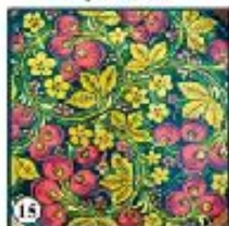
Чёрный фон "Вишня"