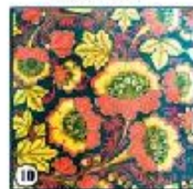
Чёрный фон "Цветы"