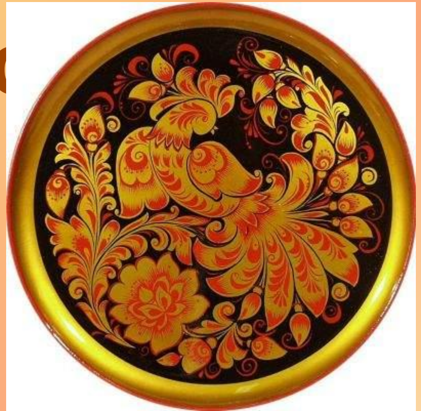
Тарелка - панно