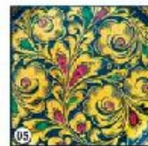
Кудрина "Преддверье старинное"