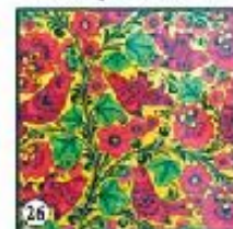
Зеленый фон "Птицы в цветах"