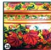
Зеленый фон "Птицы в гнездах"