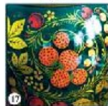
Чёрный фон "Ежевика"