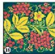
Чёрный фон "Рябина"