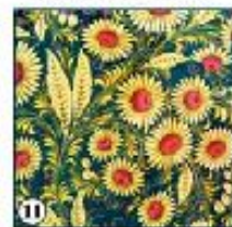
Чёрный фон "Розовый"