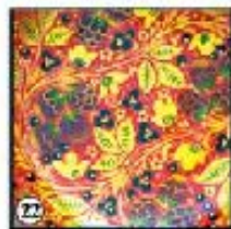
Красный фон "Ягоды"