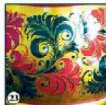
Зеленый фон "Клевета"