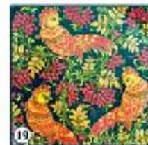
Чёрный фон "Птицы в гнездах"