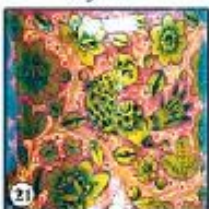
Красный фон "Птицы в цветах"