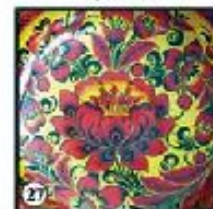
Зеленый фон "Цветы"