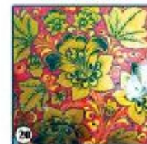
Красный фон "Цветы"