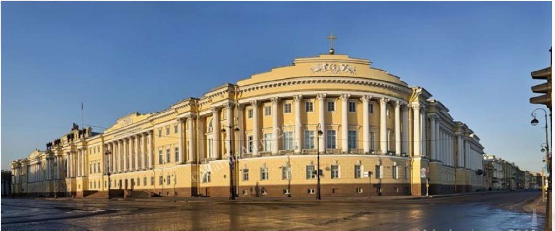
Das Gebäude des Verfassungsgerichts der Russischen Föderation („Senat und Synode“) in St.