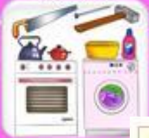
Занятия членов семьи