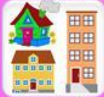
Адрес, полный и описание дома