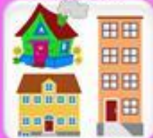
Адрес, полный и описание дома