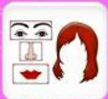
Глаза, брови, нос, губы, волосы