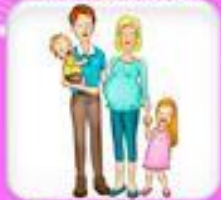
С кем живешь и кто твои близкие