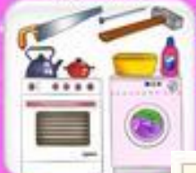
Занятия членов семьи