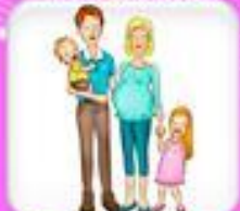
С кем живешь и кто твои близкие