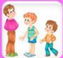
Рост (высокий, средний, маленький) и возраст