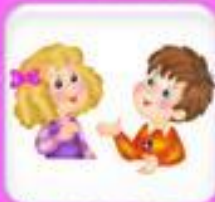
Мальчик или девочка, имя и фамилия