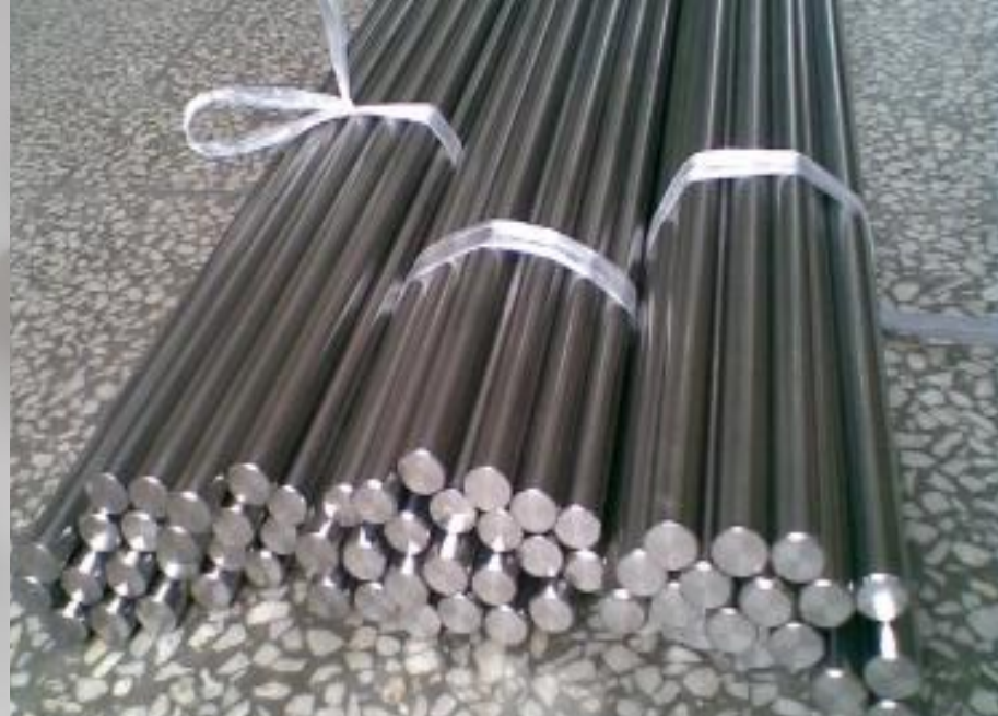
Хром, никель, медь. бокситы