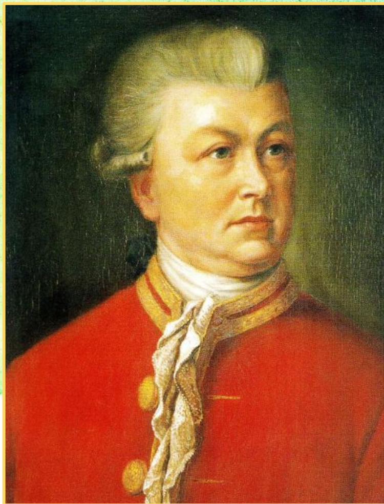
Самуила Гейнике (1727-1790)