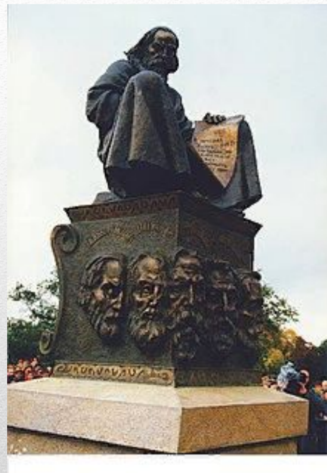
Памятник Любечскому съезду князей.

В 1097 году Владимир Мономах созвал всех враждующих между собой внуков Ярослава в городе Любече на общий княжеский съезд. Сидя на одном ковре, князья признали, что усобицы идут на пользу только половцам, которые «землю нашу несут розно и рады, что между нами идут войны. Да отныне объединимся единым сердцем и будем блюсти Русскую землю, и пусть каждый владеет вотчиной своей». Князья договорились, кому какой вотчиной владеть, и целовали крест на том, что если кто заведет смуту, то идти на него всем князьям, всей землею.