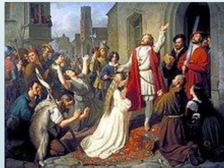
Реформация в Германии