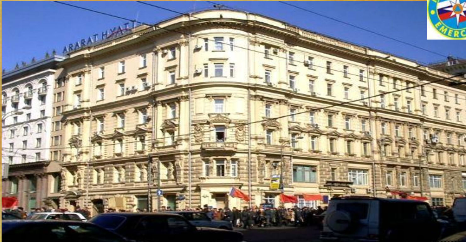
Здание МЧС России в Москве

МЧС - федеральный орган по обеспечению безопасности населения и государства при различных катастрофах, а также центр, организующий необходимые исследования и интегрирующий достижения науки и техники, мировой опыт в этой области