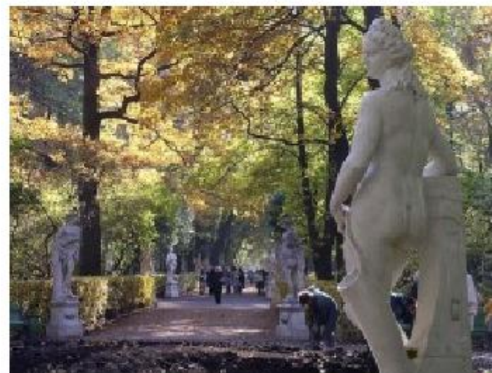
Летний сад в Петербурге