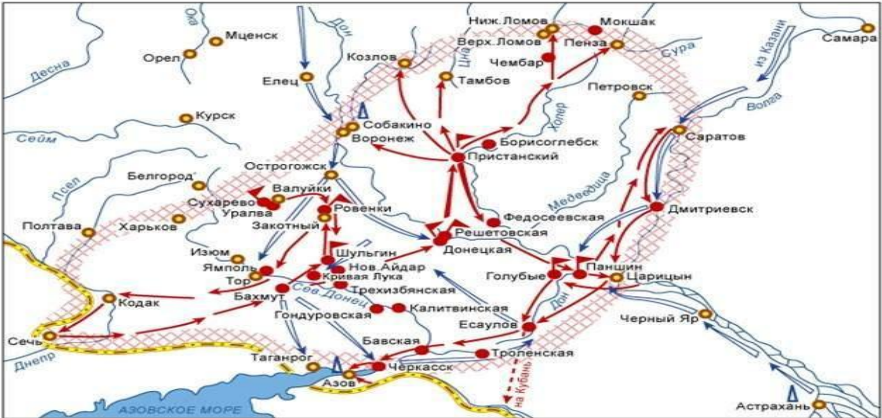
БУЛАВИНСКОЕ ВОССТАНИЕ 1707-1709 гг.