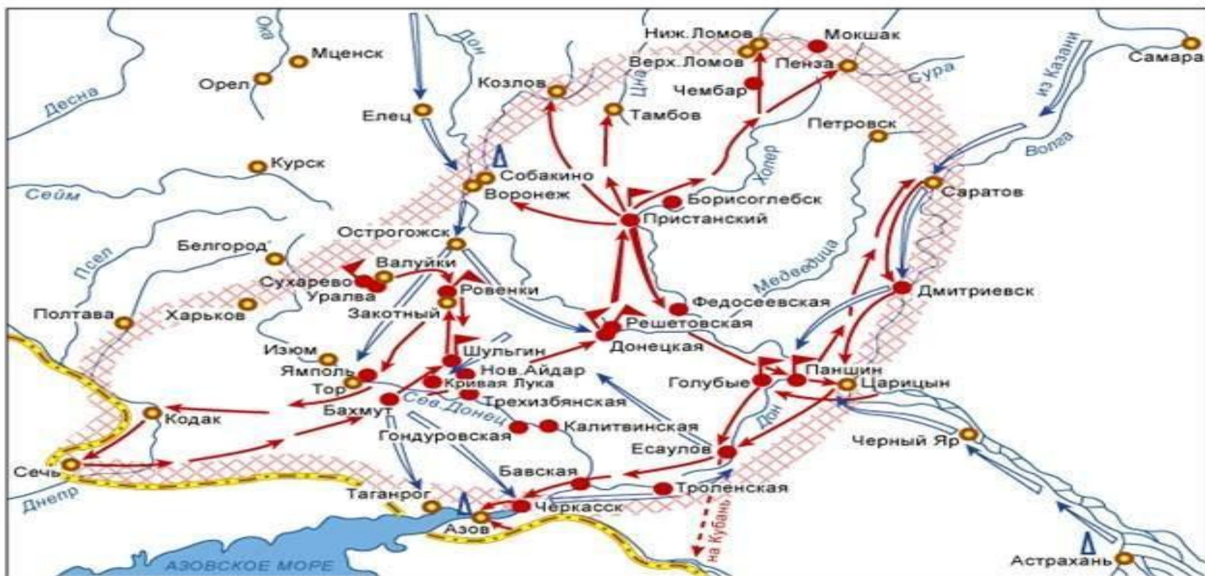
БУЛАВИНСКОЕ ВОССТАНИЕ 1707-1709 гг.