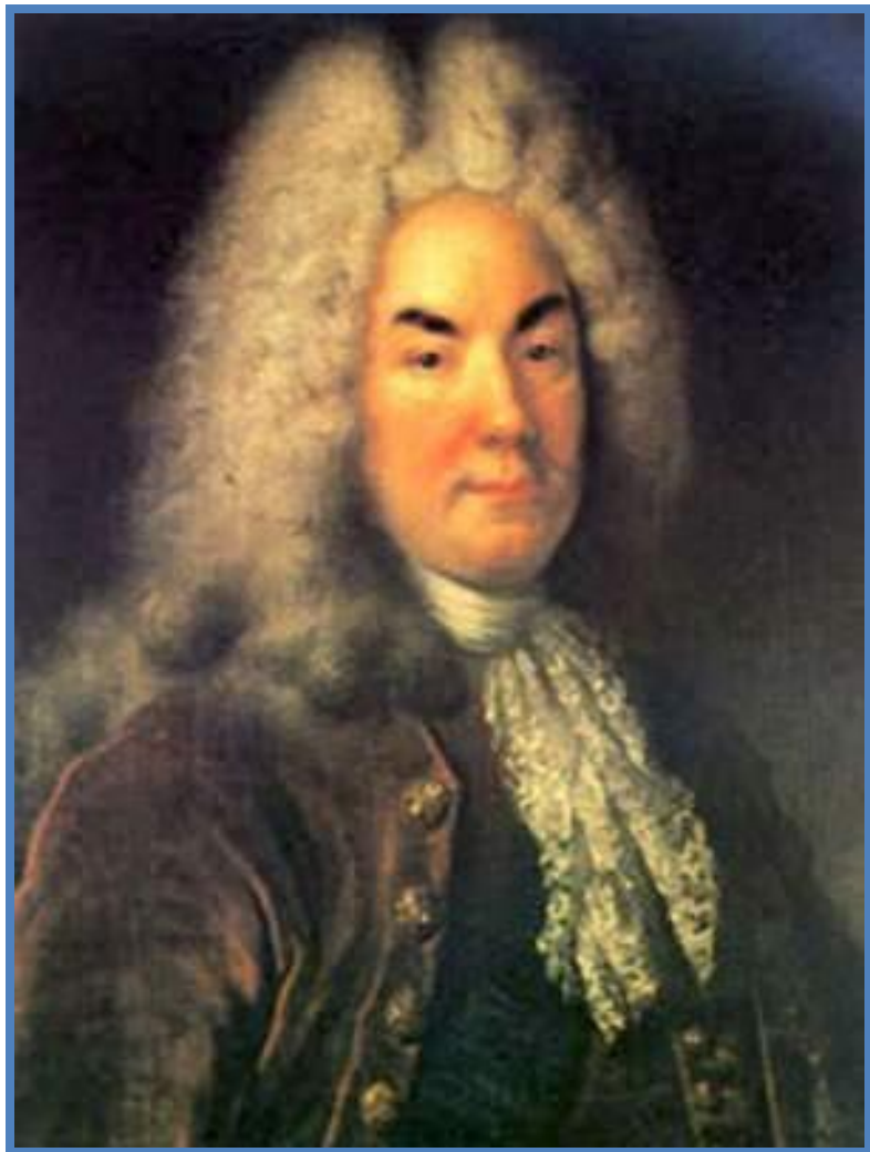
П. А. Толстой

Ошеломленный Петр послал лучших дипломатов, чтобы урегулировать конфликт. От Австрии он потребовал выдачи царевича, но получил отказ. Однако венский двор разрешил представителям Петра вступить с ним в переговоры. В Неаполь выехал многоопытный дипломат П. А. Толстой (1645—1729), который от имени царя в случае возвращения обещал Алексею прощение. Однако на границе Алексей был арестован и вскоре предстал перед следствием.