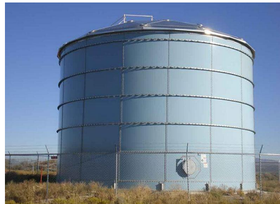
з 01.07.2019 1000 куб.м.<резервуар \leq 20000 куб.м.