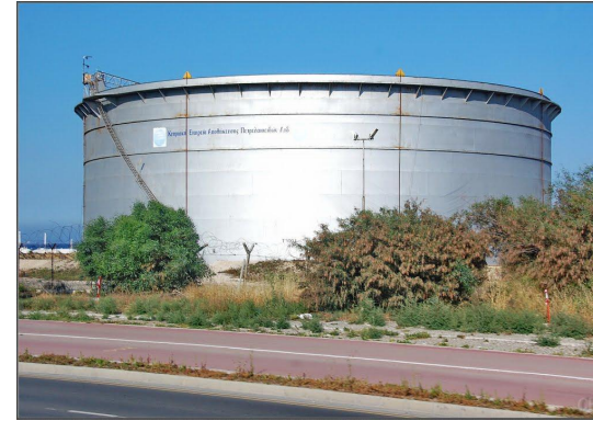
з 01.01.2019 резервуар > 20000 куб.м.