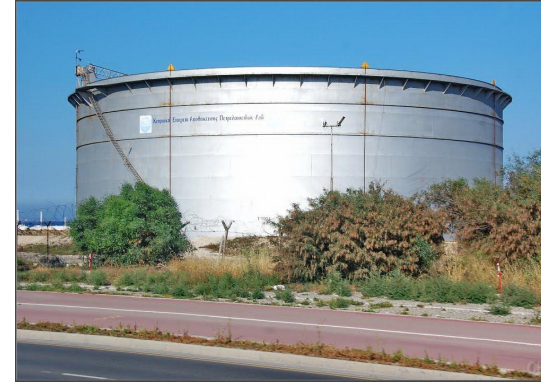
з 01.01.2019 резервуар > 20000 куб.м.