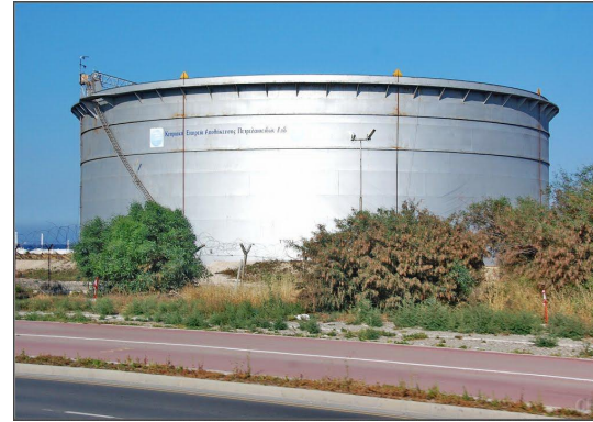
з 01.01.2019 резервуар > 20000 куб.м.