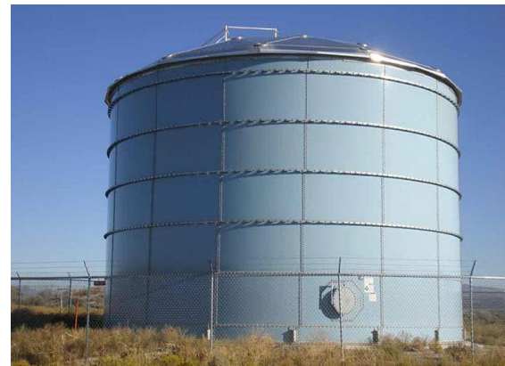
з 01.07.2019 1000 куб.м.<резервуар \leq 20000 куб.м.