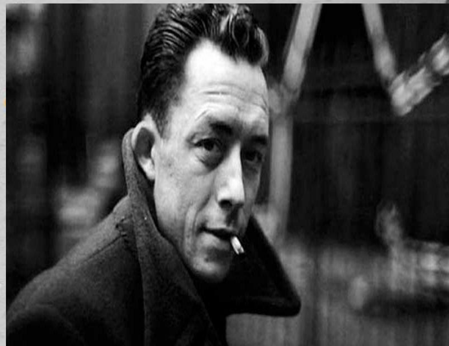
Французский мыслитель (1913-1960)

Те же, кто наполняют жизнь смыслом, рано или поздно понимают, что впереди (куда они изо всех сил идут) – смерть, Ничто. Смертны все – и наполняющие жизнь смыслом, и не наполняющие.