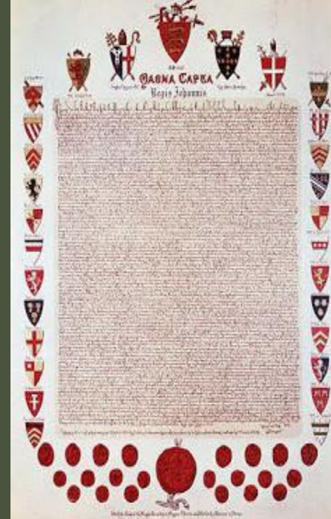
Magna Charta Libertatum