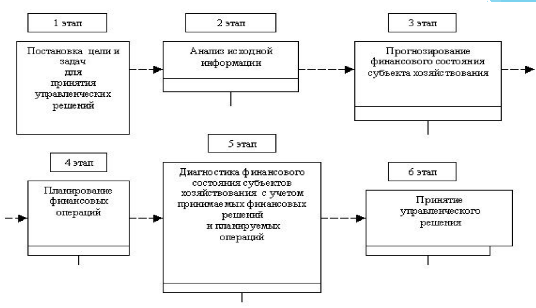
Рисунок 2 - Процесс принятия отдельных управленческих решений