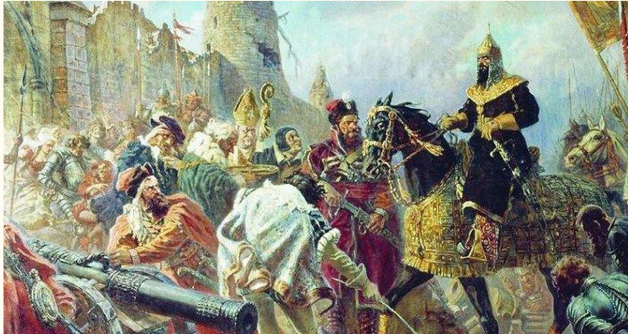
Ливонская война 1558—1583