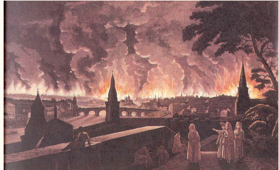
Пожар в Москве