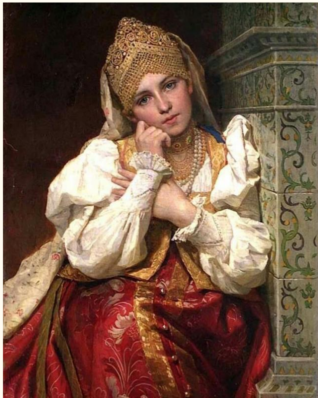
Мария Долгорукая 1555-1573