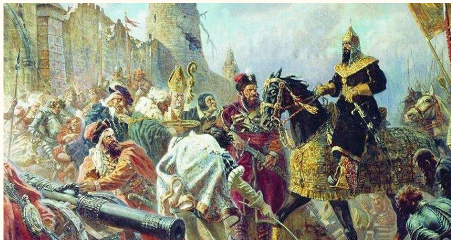
Ливонская война 1558—1583