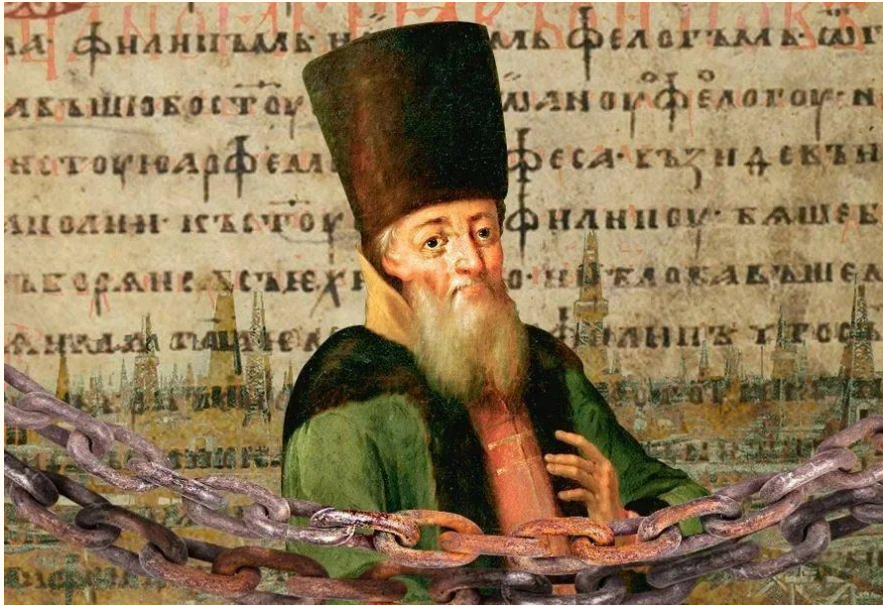
Дипломат Иван Висковатый