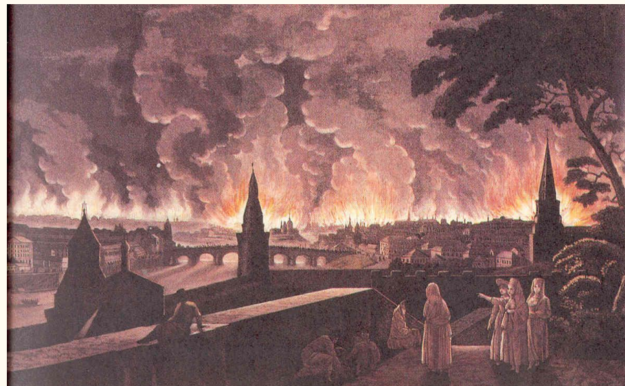
Пожар в Москве