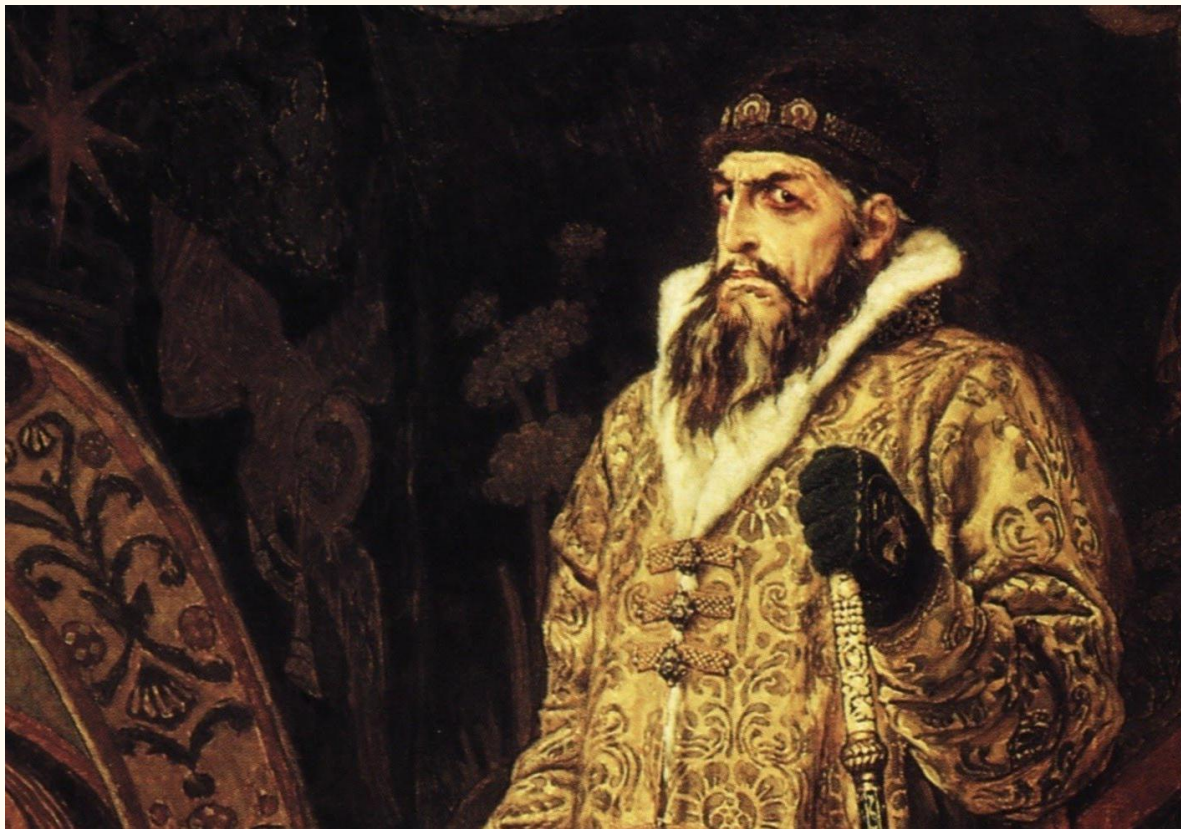
Тит-Смарагд-Иоанн Васильевич Рюрик (Иван Грозный) 1530-1584 гг.