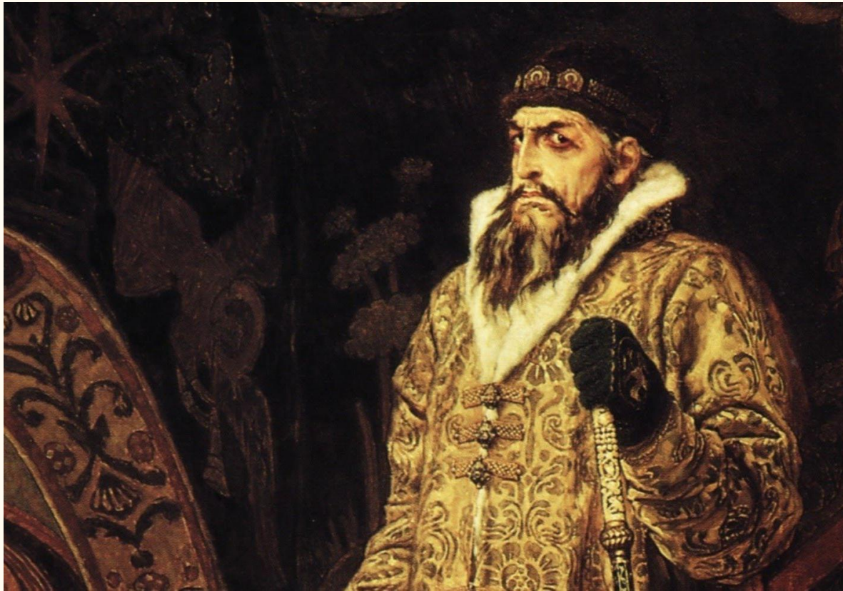
Тит-Смарагд-Иоанн Васильевич Рюрик (Иван Грозный) 1530-1584 гг.