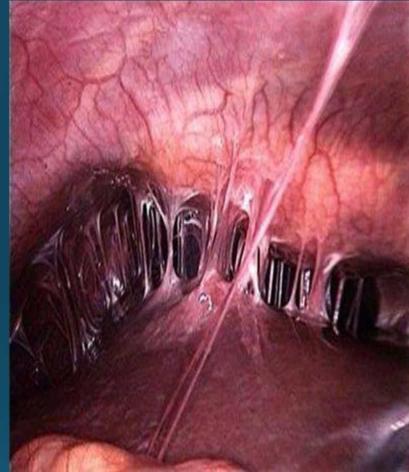
Спайки в малом тазу

• Спаечная болезнь малого таза (пластический пельвиоперитонит) – это заболевание, которое характеризуется образованием между внутренними органами малого таза (матка, придатки, связки, мочевой пузырь и петли толстого кишечника