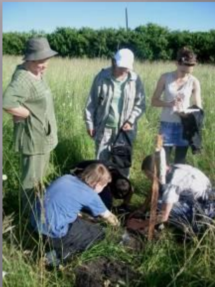
Эколого-информационный центр заповедника – основная база для проведения работы по экологическому просвещению школьников и студентов.