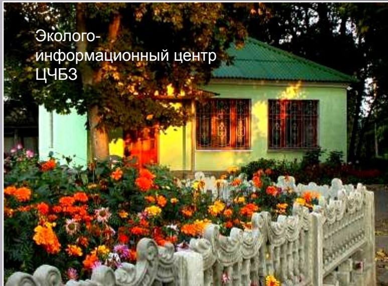
Эколого-информационный центр ЦЧБЗ