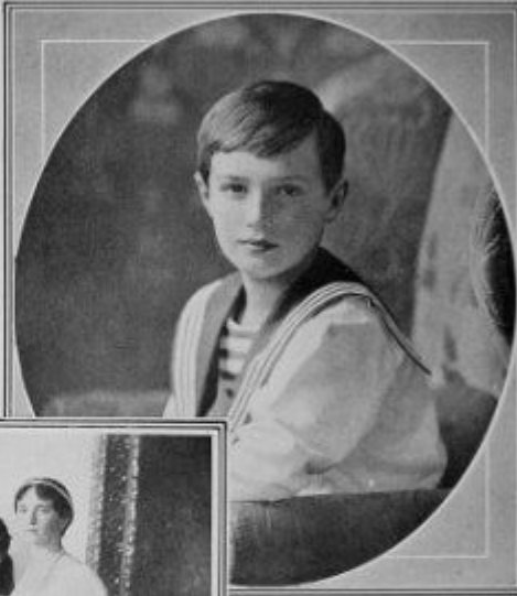
The Tsarevich, aged 14