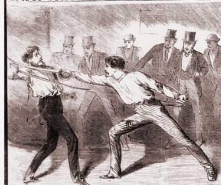
ORDINARY DUEL WITH BROAD SWORDS