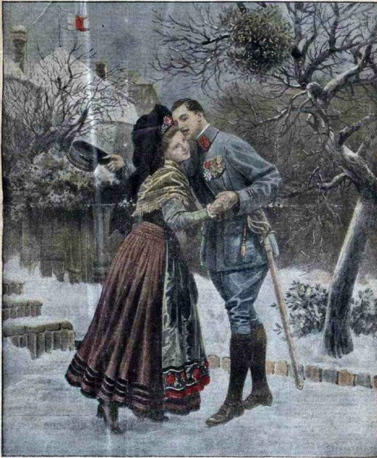
Bonne année, petite sœur d'Alsace!

ADMINISTRATION 5 CENT. SUPPLEMENT ILLUSTRÉ 5 CENT. ABONNEMENTS 26 me Année N° 1.068 DIMANCHE 2 JANVIER 1916