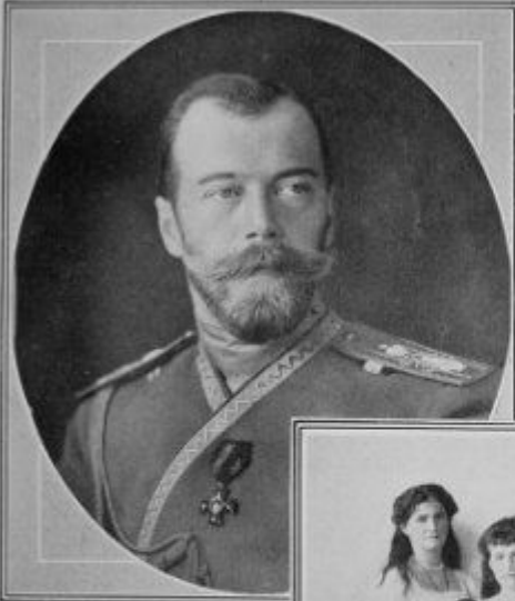
The Tsar of Russia—Nicholas II.