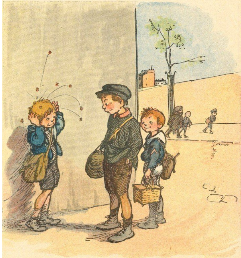
— Veinard... : son père est venu en perm! Dessin de POULBOT.

1 er 4004 — 21 e Année PRIX DU NUMÉRO : 40 CENTIMES 28 Avril 1909