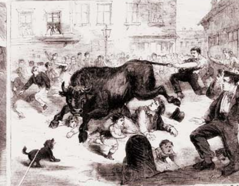
CHASE AFTER A MAD BULLOCK