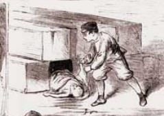
BODY OF A CHILD FOUND UNDER TIMBER