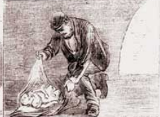
BODY OF A CHILD FOUND UNDER AN ARCH