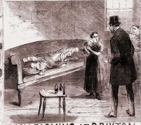
BABY FARMING AT BRIXTON