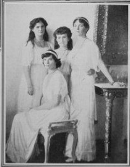
The Imprisoned Daughters of the late Tsar of Russia

Further statements with regard to the reported shooting of the ex-Tsar of Russia were published on Monday of this week. It appears that the death of the late ruler is actually admitted and accepted by the British Government of Hergravel.