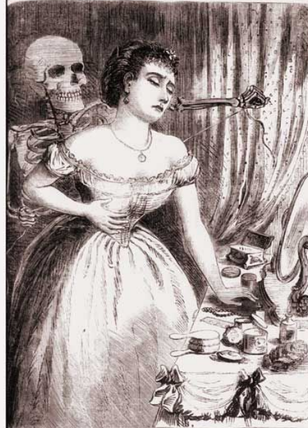
DEATH THROUGH TIGHT LACING