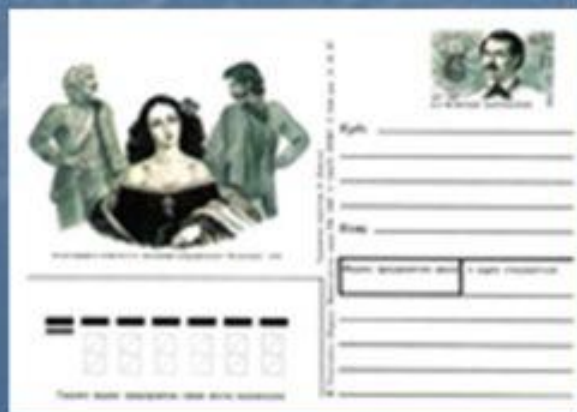
юбилейная почтовая открытка с портретом А.А. Бестужева-Марлинского

В 1929 году Бестужев переведен по его прошению рядовым на Кавказ, где в то время шли военные действия (правда, с особым указанием императора не повышать его в чине независимо от боевых заслуг). На Кавказе он встречается в Эрзруме с братьями Петром и Павлом — тоже ссыльными декабристами. Вскоре его по доносу переводят в дербентскую крепость, где он участвует в 1931 году в боевых действиях при осаде Дербента имамом Кази-муллой. В походе под командованием Н.П. Панкратьева Бестужев отличился в боях. События эти описаны им в «Письмах из Дагестана» (1832). От тоски по России Бестужева спасает лишь его способность сохранять вопреки обстоятельствам «весьма веселый характер».