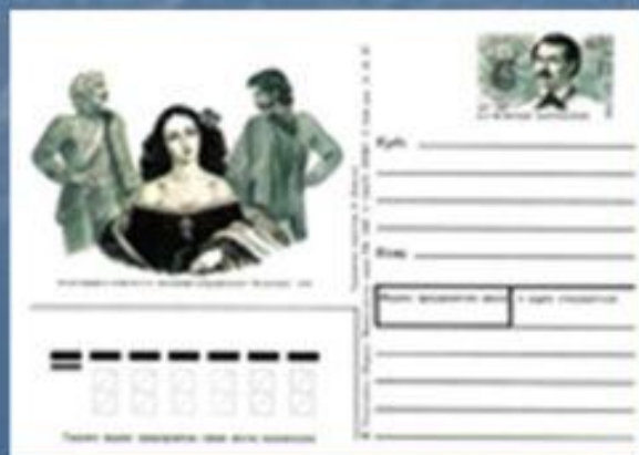
юбилейная почтовая открытка с портретом А.А. Бестужева-Марлинского