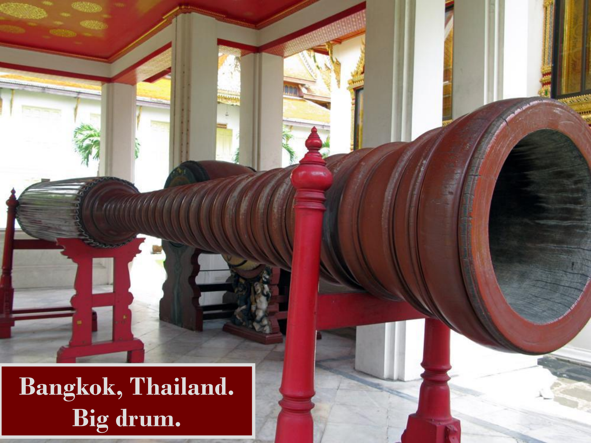
Bangkok, Thailand. Big drum.