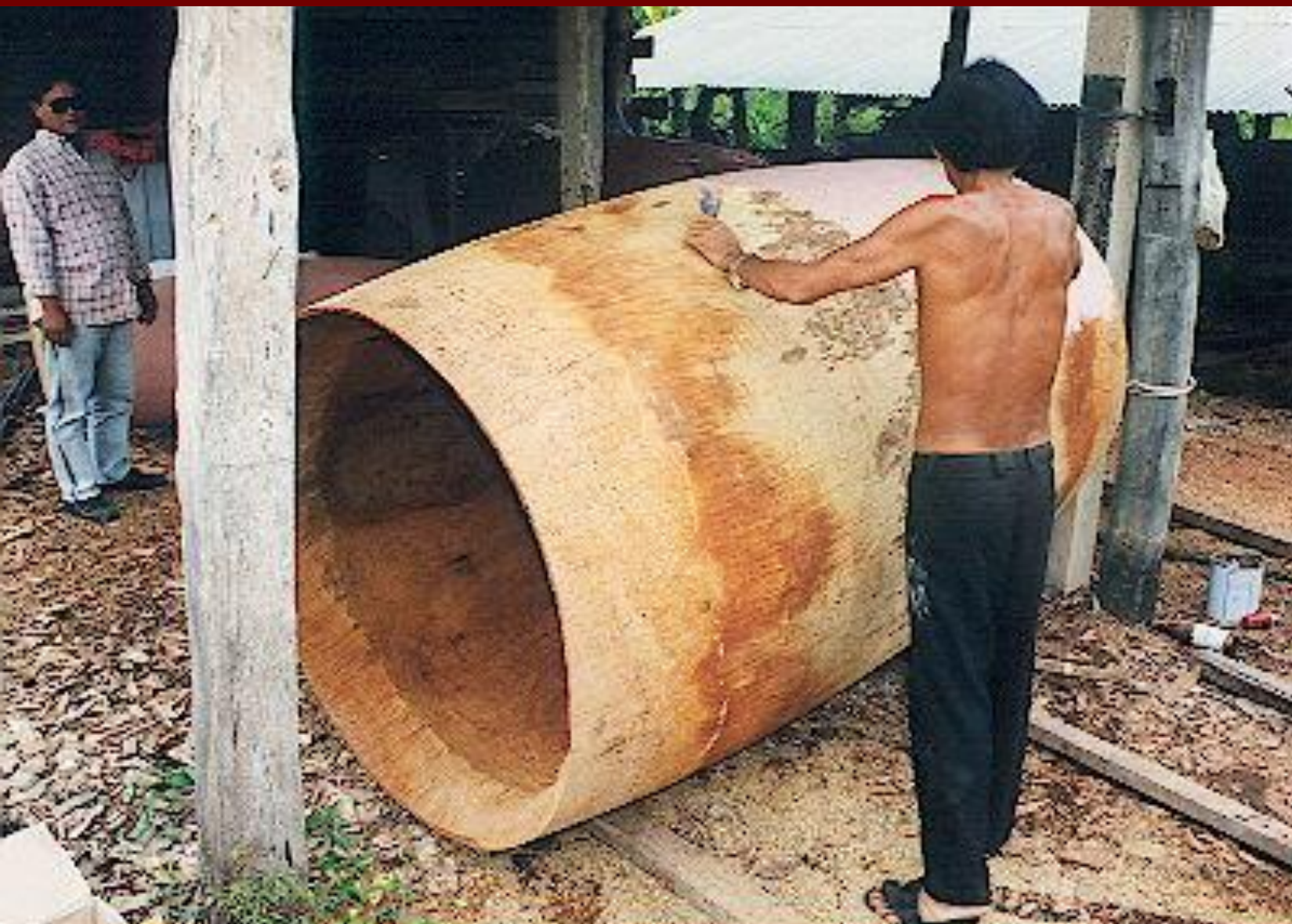
Таиландские барабаны из цельного ствола дерева