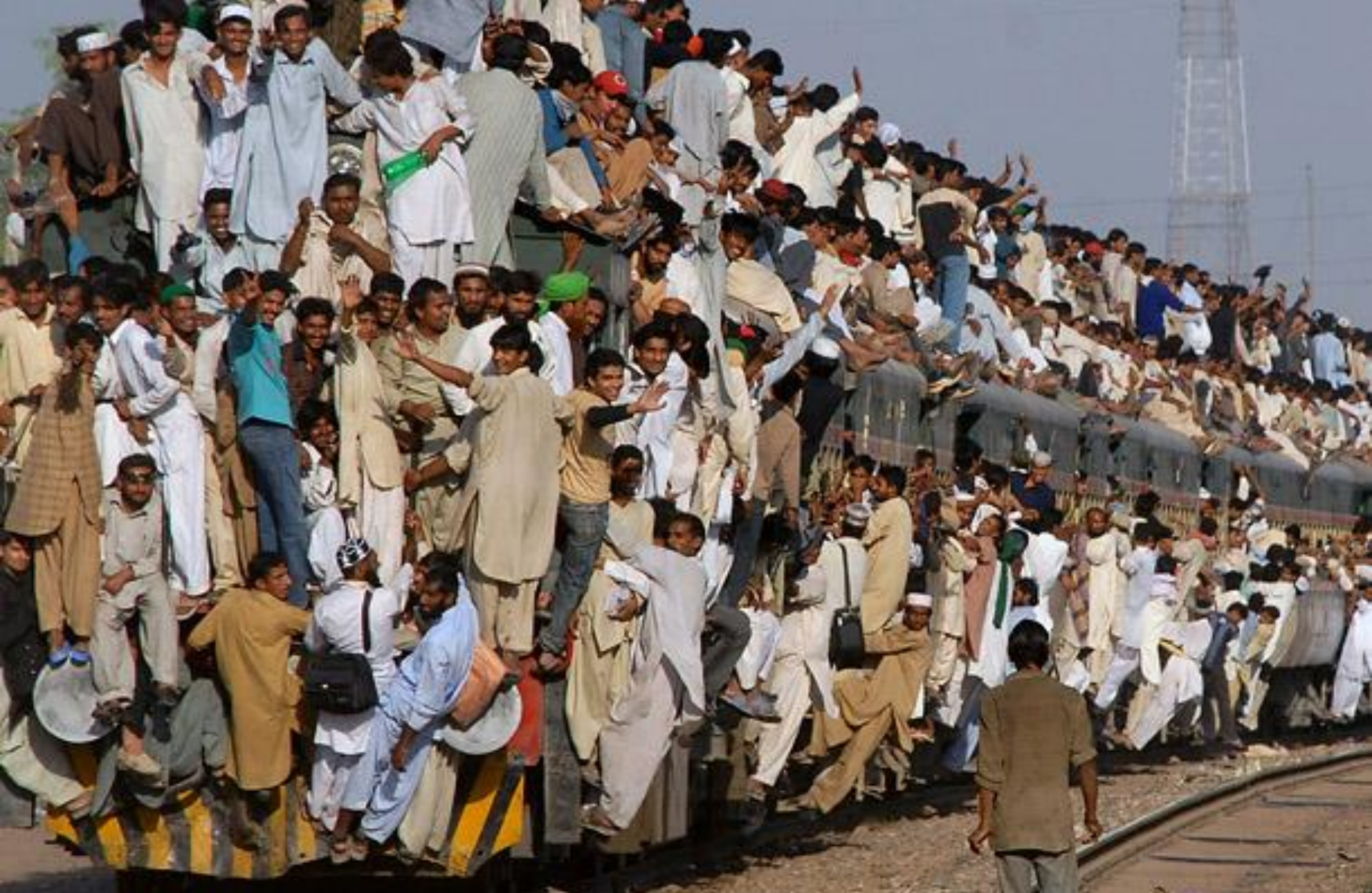
Sunni Muslims ride the train home after attending annual religious ceremonies in Pakistan