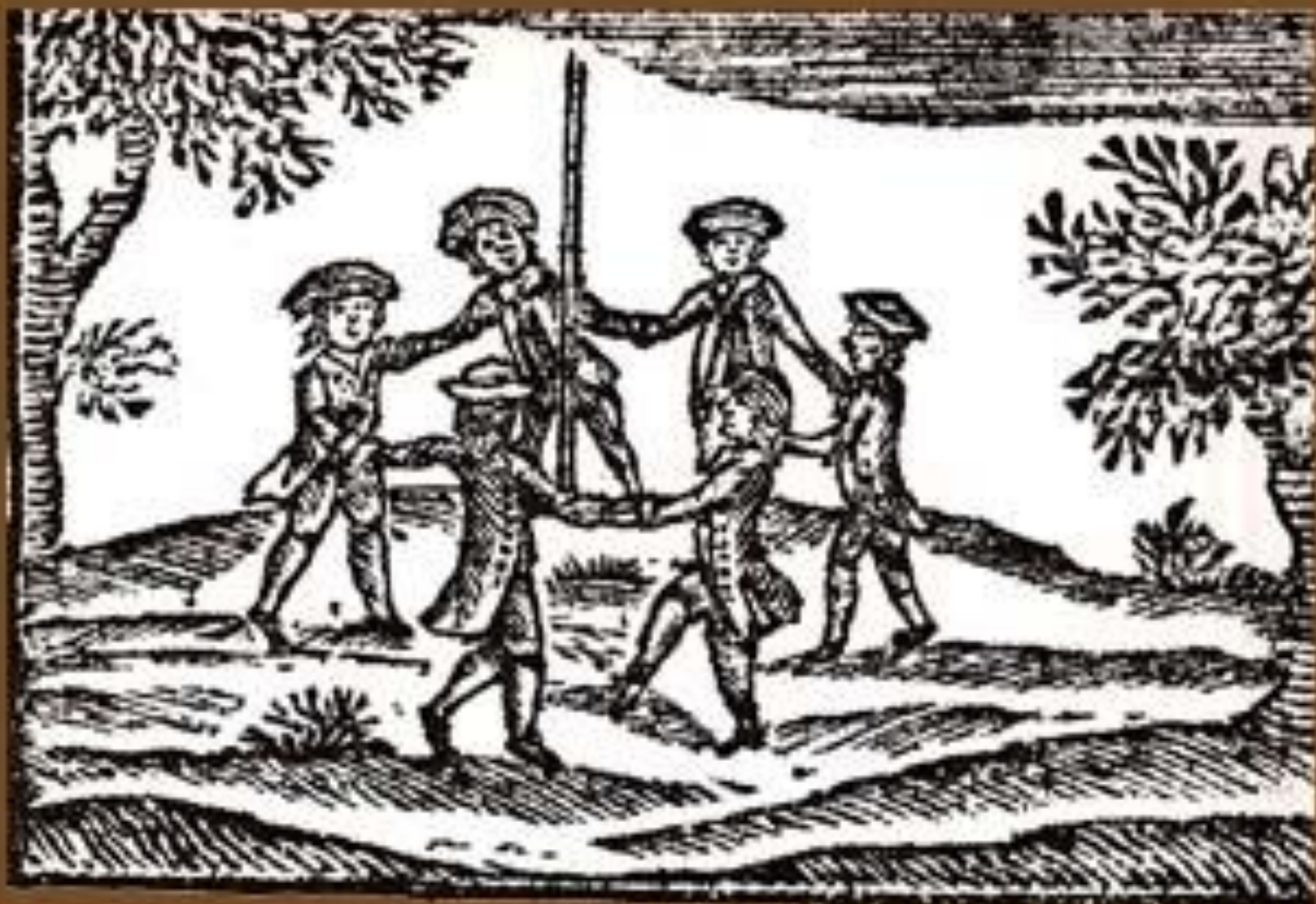
Dancing round the MAY-POLE