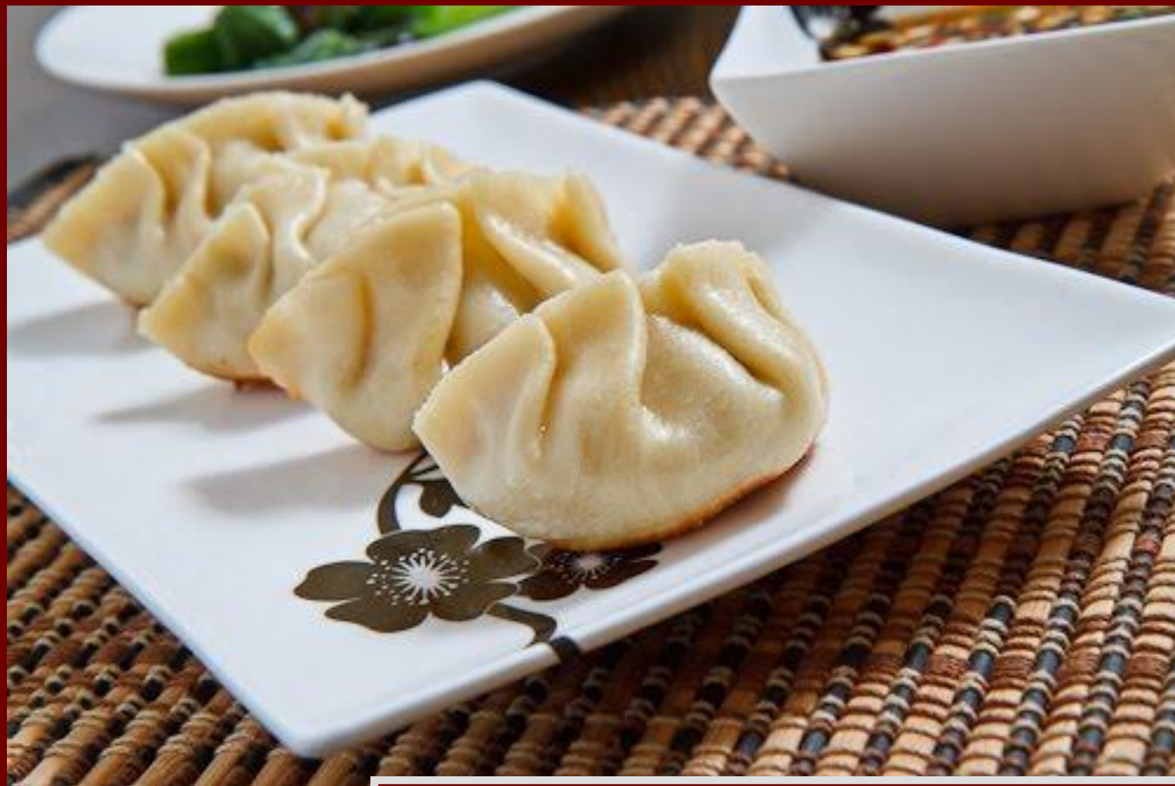
Китайские пельмени, цзяоцзы