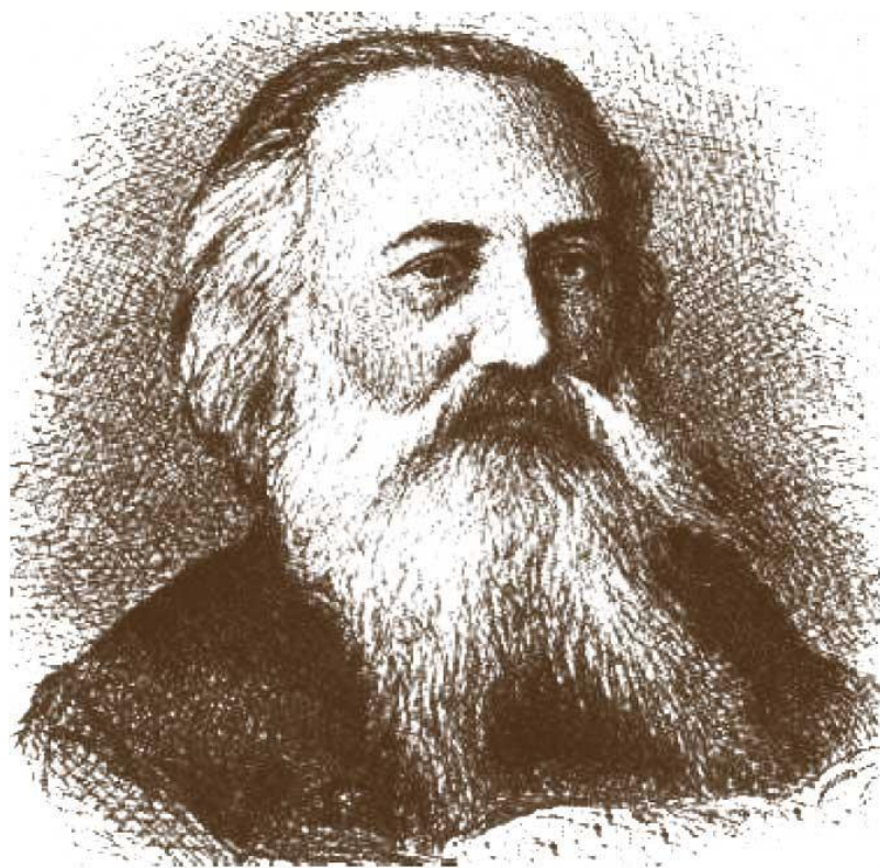
Николай Федорович Федоров

Идеи русского философа Н.Ф. Федорова XIX в.: