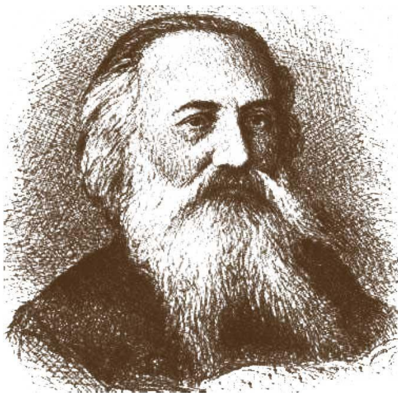
Николай Федорович Федоров

Идеи русского философа Н.Ф. Федорова XIX в.: