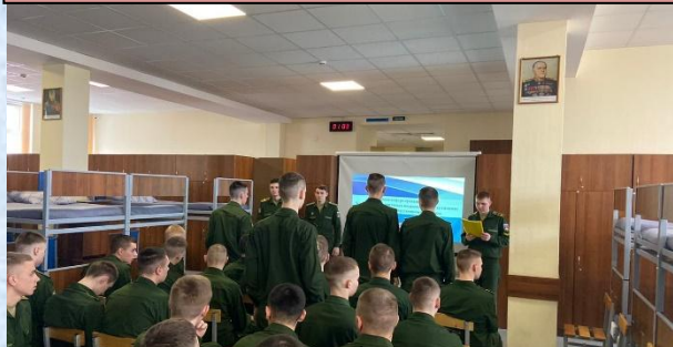
Проведение правового информирования на тему: «Уголовная ответственность военнослужащих за хищение военного и государственного имущества»