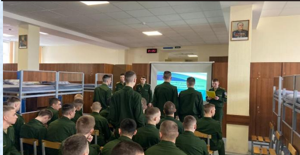
Проведение правового информирования на тему: «Уголовная ответственность военнослужащих за хищение военного и государственного имущества»