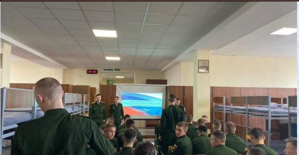
Проведение правового информирования на тему: «Уголовная ответственность военнослужащих за хищение военного и государственного имущества»