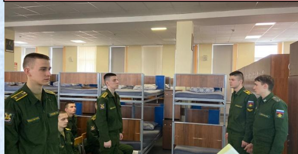
Проведение правового информирования на тему: «Уголовная ответственность военнослужащих за хищение военного и государственного имущества»