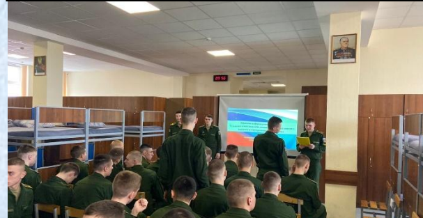
Проведение правового информирования на тему: «Уголовная ответственность военнослужащих за хищение военного и государственного имущества»