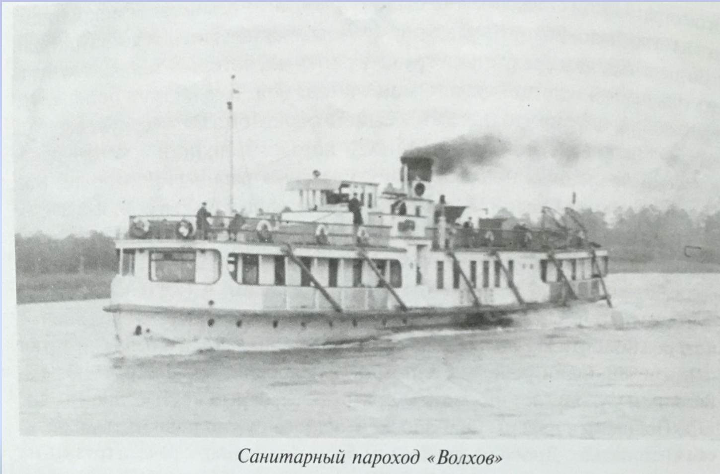
Санитарный пароход «Волхов»