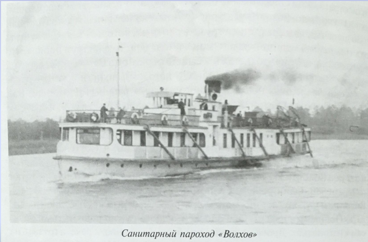
Санитарный пароход «Волхов»