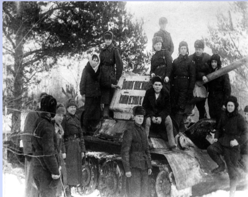
ДЕЛЕГАЦИЯ ТРУДЯЩИХСЯ ВОЛОГОДСКОЙ ОБЛАСТИ В ВОИНСКОЙ ЧАСТИ ПЕРЕДАЕТ ТАНКОВУЮ КОЛОННУ „ВОЛОГОДСКИЙ КОЛХОЗНИК“, ПОСТРОЕННУЮ НА СРЕДСТВА ВОЛОГЖАН.