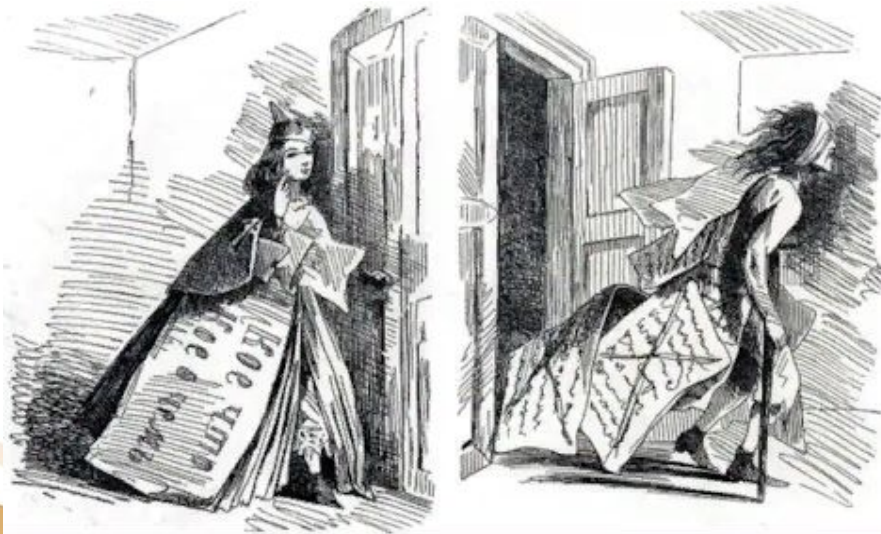
Статья до и после просмотра цензором. Карикатура.

В 1865 г. была проведена цензурная реформа . Общество проявляло пристальный интерес к изменению законодательства о печати, что объяснялось не только постоянными требованиями гласности и свободы слова. Старая система, которая требовала предварительного цензурного просмотра любой печатной продукции, препятствовала нормальной журнально-газетной деятельности, ориентированной на получение прибыли, делала невозможным издание ежедневных газет, сообщающих свежие новости и рассчитанных на массового читателя.