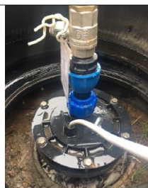
Фото №8 скважина