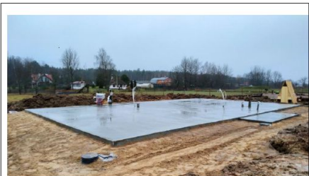
Фото №5 фундамент с коммуникациями