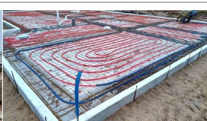
Фото №6 фундамент с коммуникациями