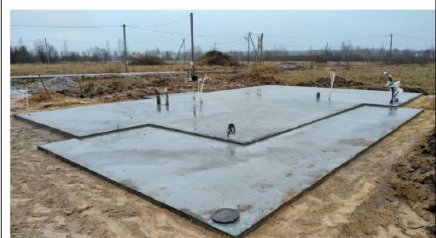
Фото №7 фундамент с коммуникациями