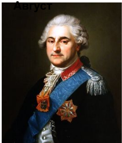
Станислав II Август

Последний король польский и великий князь литовский в 1764—1795 гг.