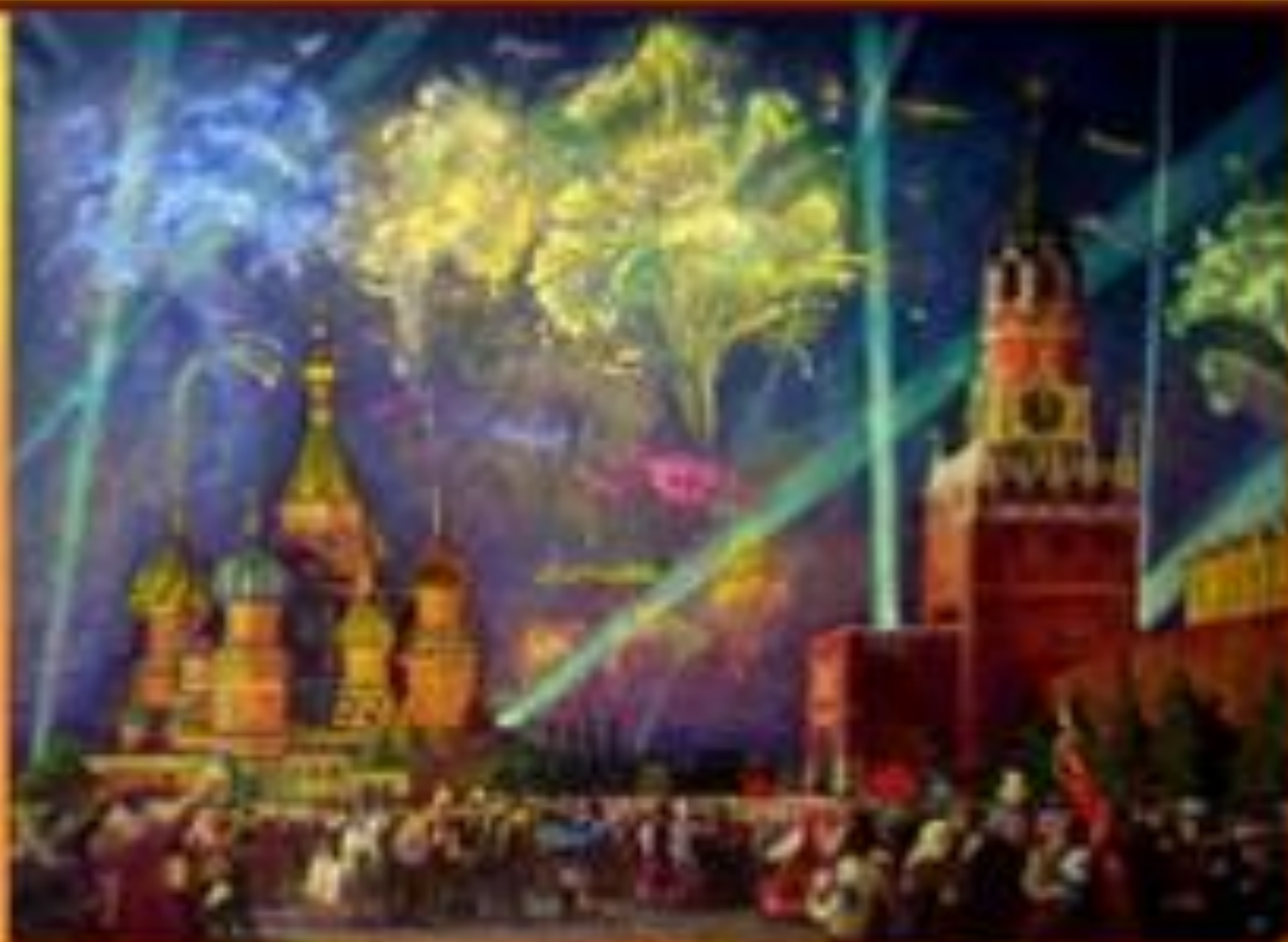
Каждый год в День Государственного флага России мы празднуем свой праздник.