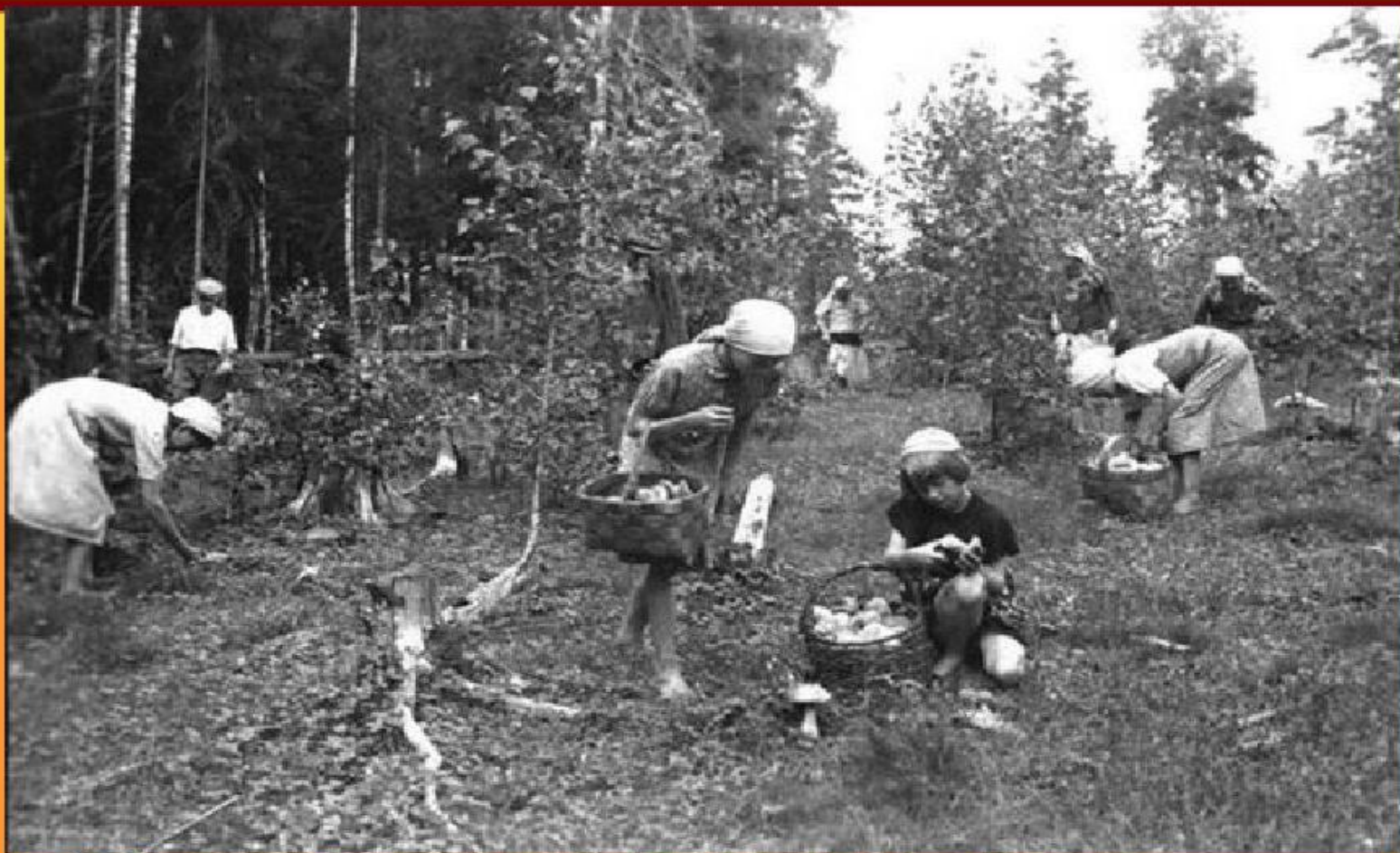
Собирали грибы и ягоды.