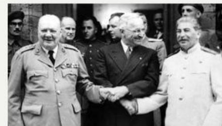
У.Черчилль, Г.Трумэн, И.Сталин

Восточную Пруссию ликвидировали. Ее земли делили между СССР и Польшей. Было принято предложение Сталина о польско-германской границе по рекам Одер и Нейса. К Польше отходили Данциг (Гданьск) и большая часть Восточной Пруссии. Кенигсберг (с 1946 года — Калининград) и прилегающие районы передавался СССР.