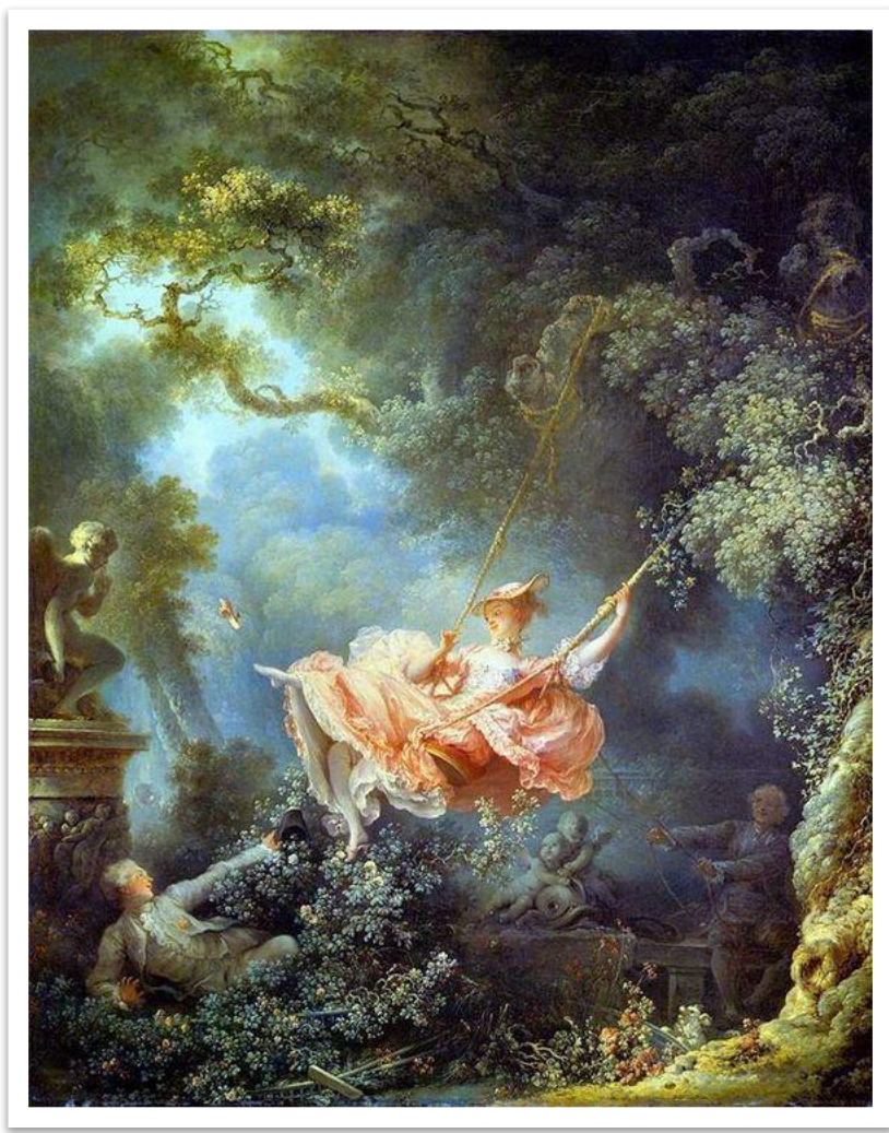
Жан Оноре Фрагонар – «Качели», 1767г