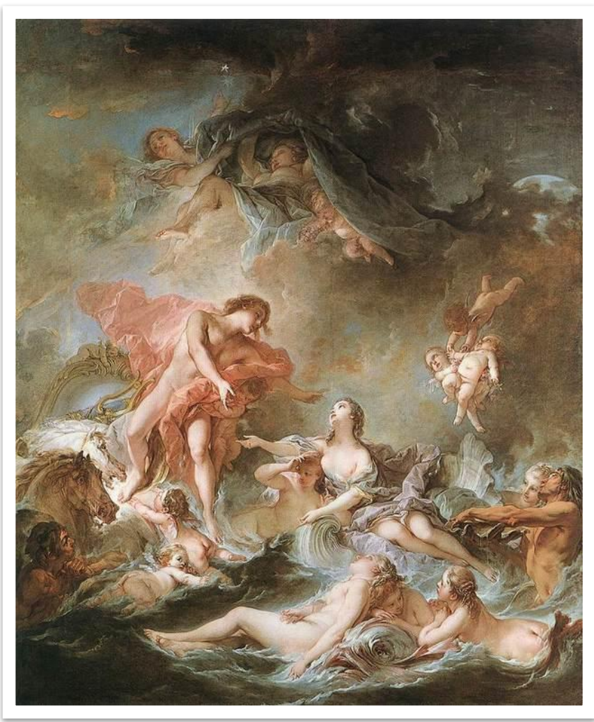
Франсуа Буше - «Закат солнца», 1752 г.