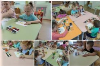
Рисование по сказке А.С. Пушкина 'Сказка о рыбаке и рыбке'