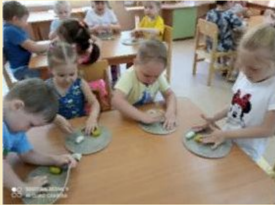
День чтения сказок А.С.Пушкина