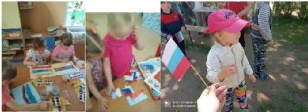
День флага России