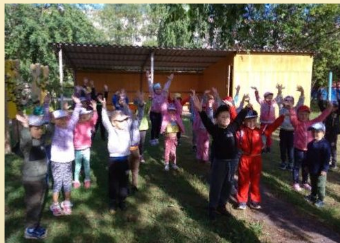
Спортивный праздник «Вместе веселее»