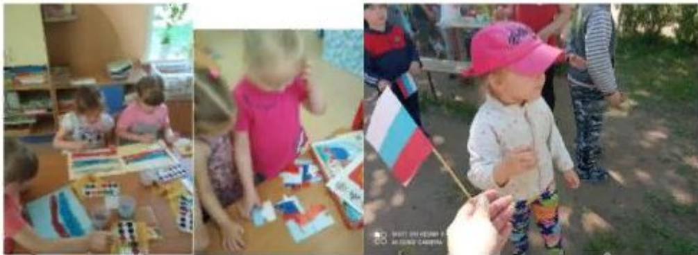
День флага России