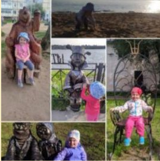
Выставка детских работ «Во дворах и на улицах Добрянки»