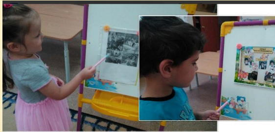
рассказы детей о своей семье