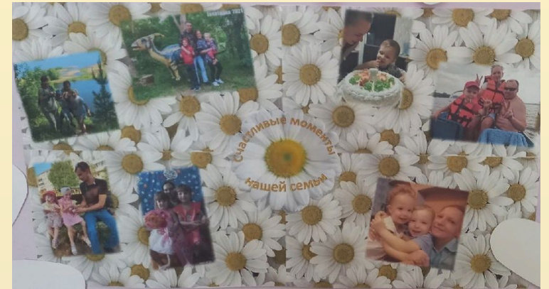
Детские работы «Ромашка для любимых родителей»