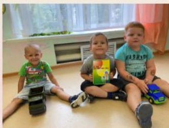
«Декада безопасности. Правила дорожного движения.»