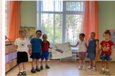
Апликация «Флаг моего государства»

Я – белый цвет – свобода, доброта, слава, Я – синий цвет – локоны родной страны, Я – красный цвет – могучая держава, Все вместе мы – едины и сильны!