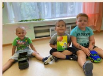
«Декада безопасности. Правила дорожного движения.»