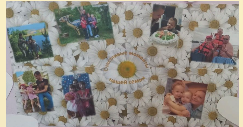
Детские работы «Ромашка для любимых родителей»