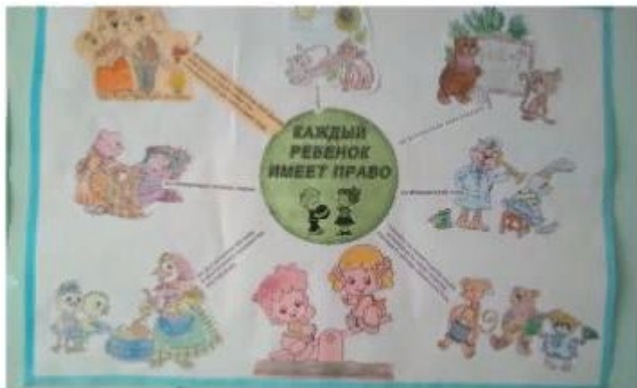
Оформление коллажа «Ребенок имеет право на семью»