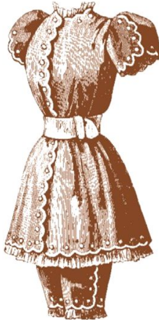
Дамский купальный костюм. 1893 г.