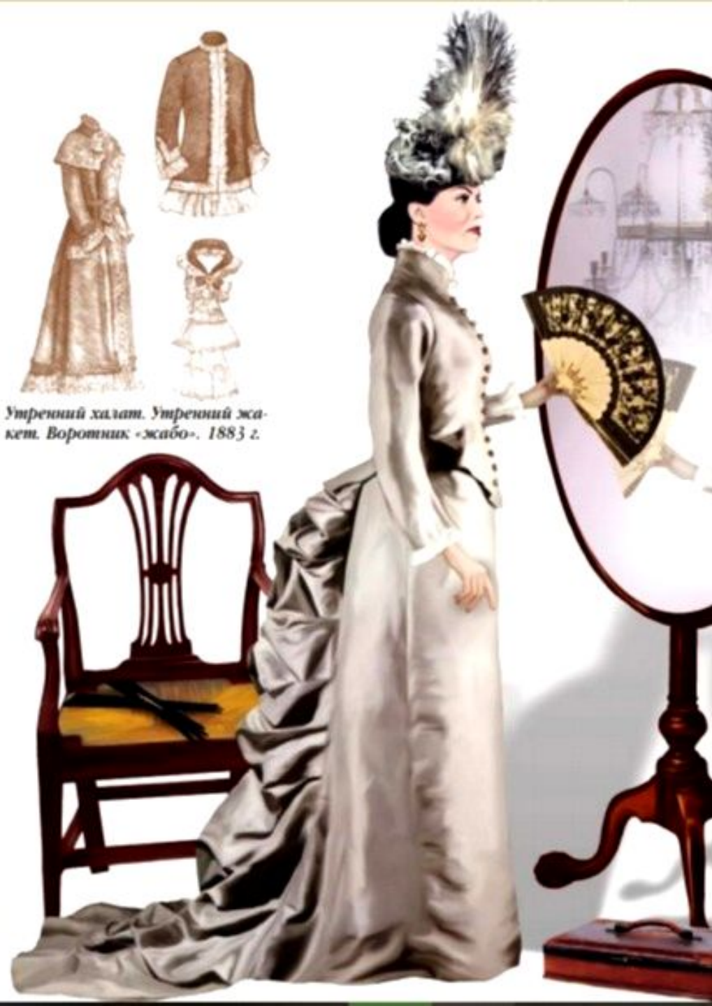
Утренний халат. Утренний жакет. Воротник «жабо». 1883 г.