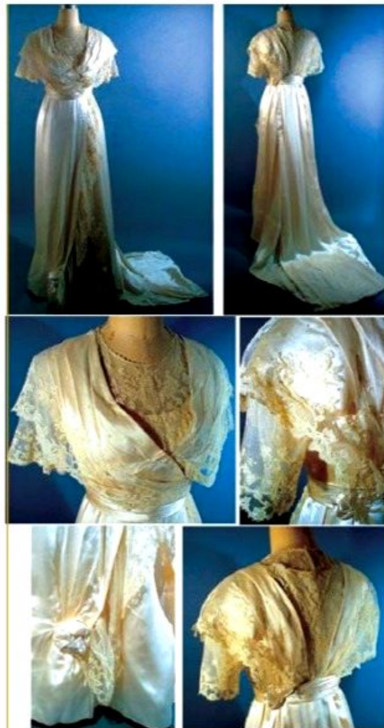
Свадебное платье 1912 г.