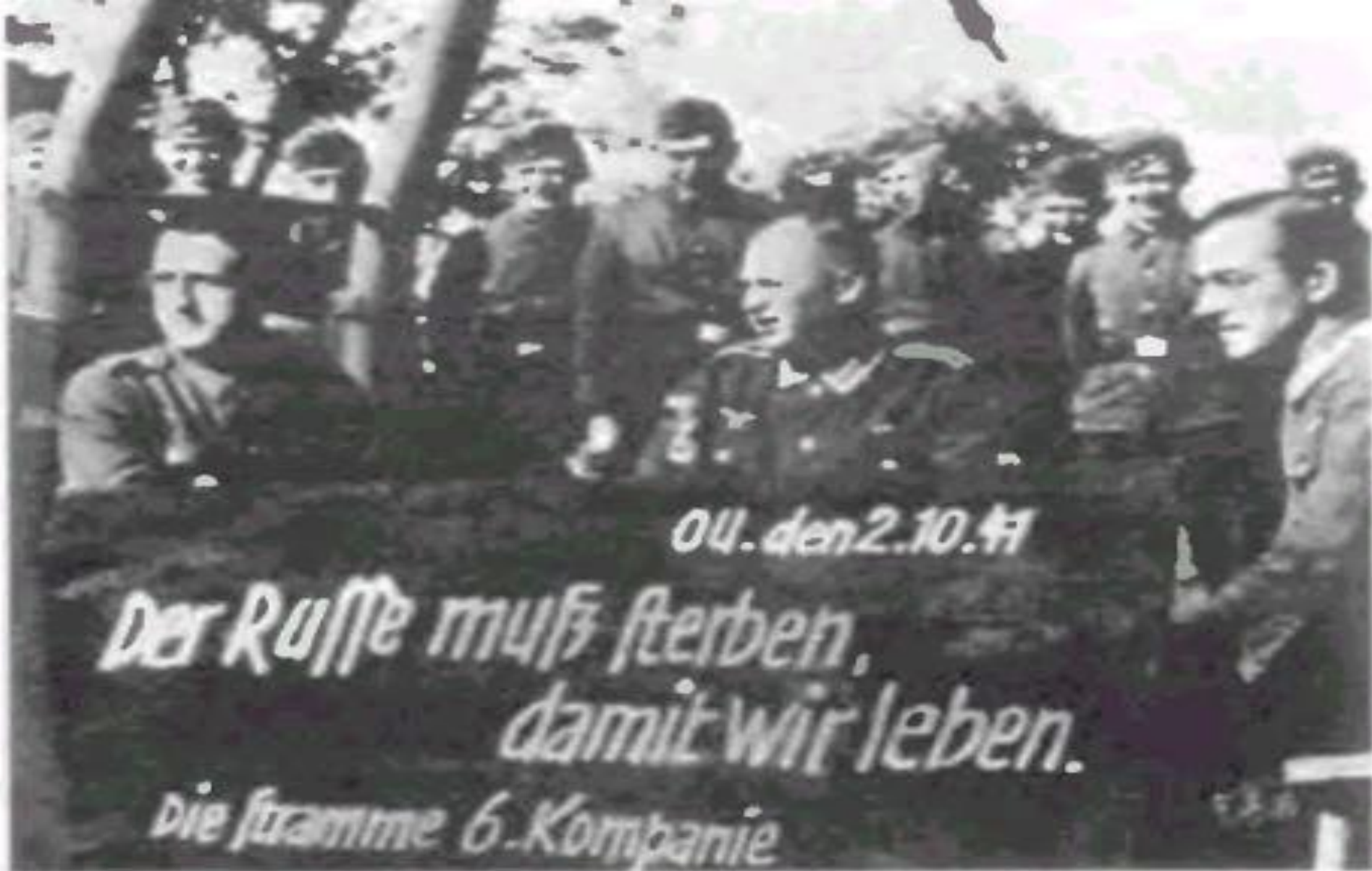
Коллективная фотография военнослужащих вермахта. На вытащенной из школьного класса доске – квинтэссенция нацистской философии: «Русский должен умереть, чтобы мы жили»