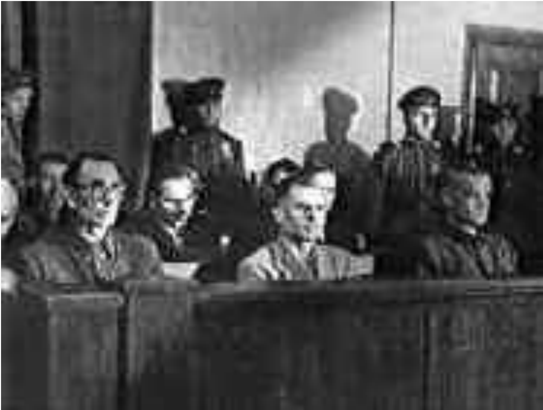
Власов на скамье подсудимых

12 мая 1945 года Власов был взят в плен советскими солдатами.