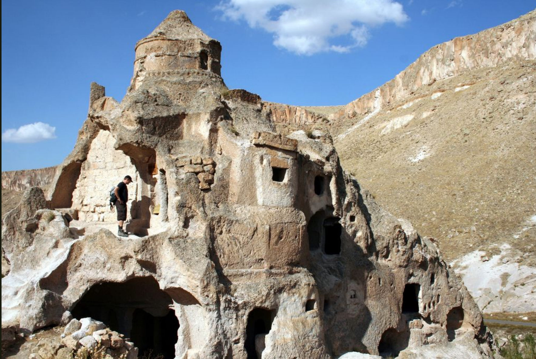
Церковь Кюббели в Каппадокии