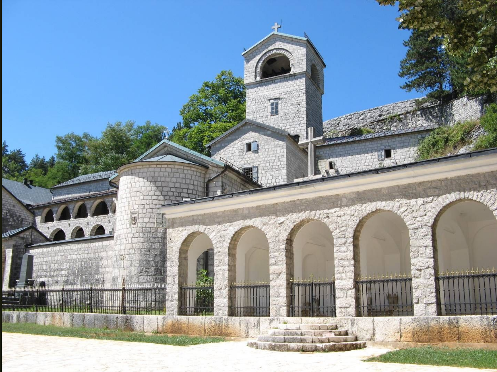
Цетинский монастырь в Черногории