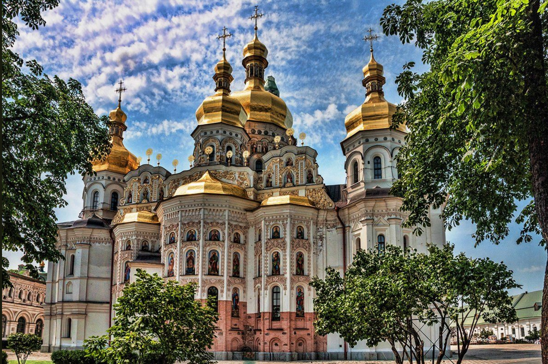
Свято-Успенская Киево-Печерская лавра