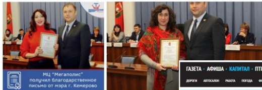
МЦ "Мегаполис" получил благодарственное письмо от мэра г. Кемерово

жизнь общества. Женщины уже не обязаны сидеть риди и воспитывать детей. Мы умеем совмещать том числе открывать и развивать собственный бизнес. того, чтобы преумножать миллионы, сколько для